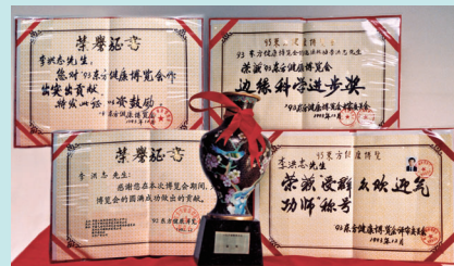
▲ 一九九三年北京东方健康博览会上，李洪志大师荣获博览会最高奖——“边缘科学进步奖”、“特别金奖”以及“受欢迎的气功师”称号。

迫害前，法轮功祛病健身之神奇功效在中国几乎家喻户晓。一九九八年，中国国家体育总局抽样调查法轮功学员 12553 人，疾病痊愈和基本康复率为 77.5%，加上好转率 20.4%，祛病健身总有效率高达 97.9%。