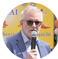
米歇尔·夏勒 Michael Gahler

“‘真、善、忍’是构建和平、民主、开放社会的基本原则。……法轮功学员是一群和平、坦诚、善良的修炼人。他们给周围的生活环境带来了积极的影响，为人与人之间的和平相处做出了贡献。”