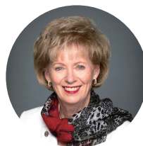
朱迪·史葛洛 Judy Sgro

“法轮功为整个世界带来改变。我们要继续感谢李洪志先生，因为他具备远见卓识，用‘真、善、忍’为法轮大法奠定基石。我想代表特鲁多总理和自由党党团鼓励你们所有人，请继续传递你们的信息——关于和平、安宁的信息，这就是大法弟子倡导的‘善’。”