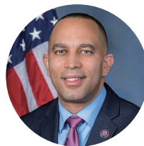
哈基姆·杰弗里斯 Hakeem Jeffries

“法轮大法多年来一直是许多人生活中不可或缺的积极组成部分。……其践行也对我们的社会产生了切实的效果。……因此我们都在庆祝这个纪念日，并且非常感谢李洪志先生创立这种修炼方法。”