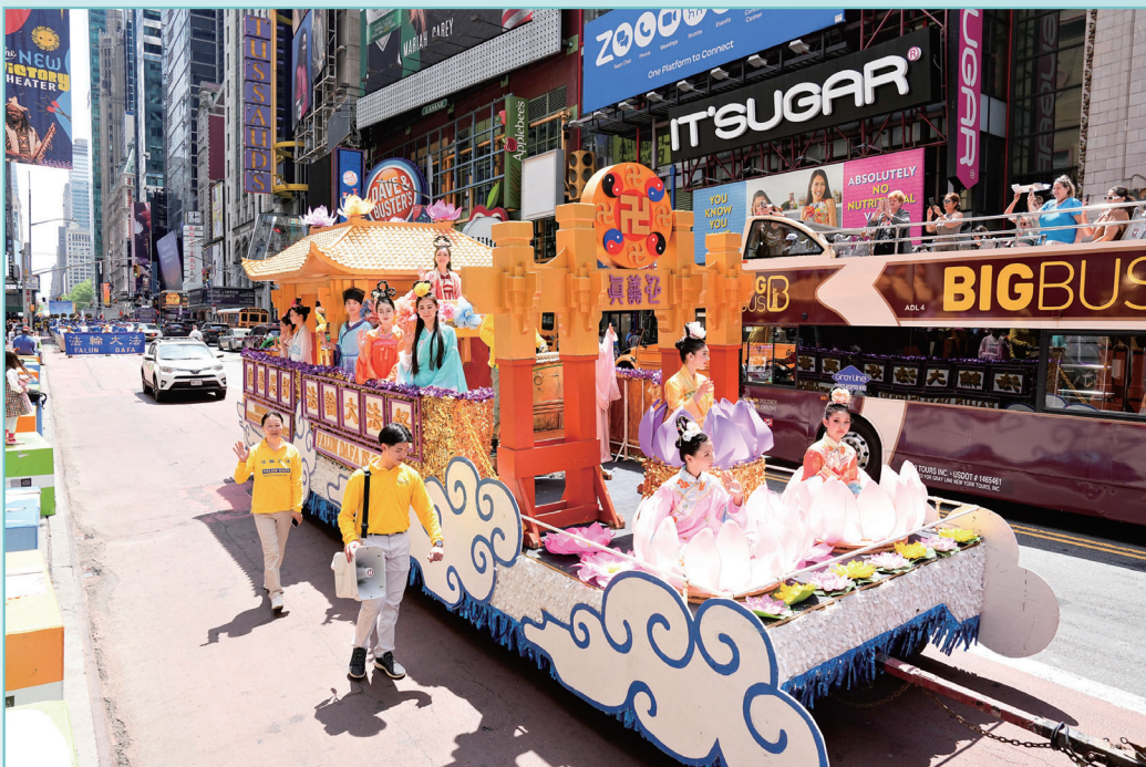
▲ 二零二三年五月十二日，数千法轮功学员在纽约曼哈顿举办盛大游行，庆祝法轮大法传世 31 周年及第 24 届世界法轮大法日。