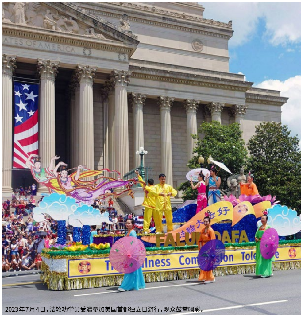
2023年7月4日，法轮功学员受邀参加美国首都独立日游行，观众鼓掌喝彩。