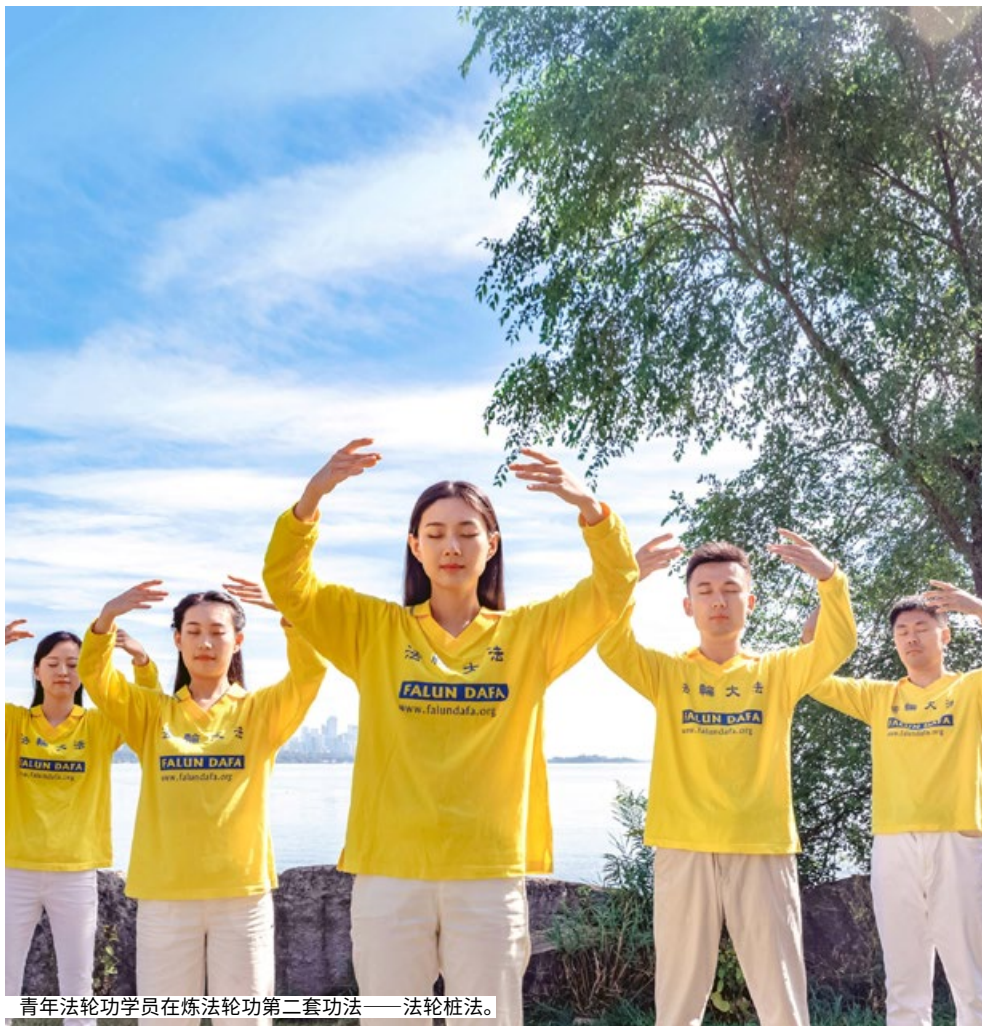
青年法轮功学员在炼法轮功第二套功法——法轮桩法。