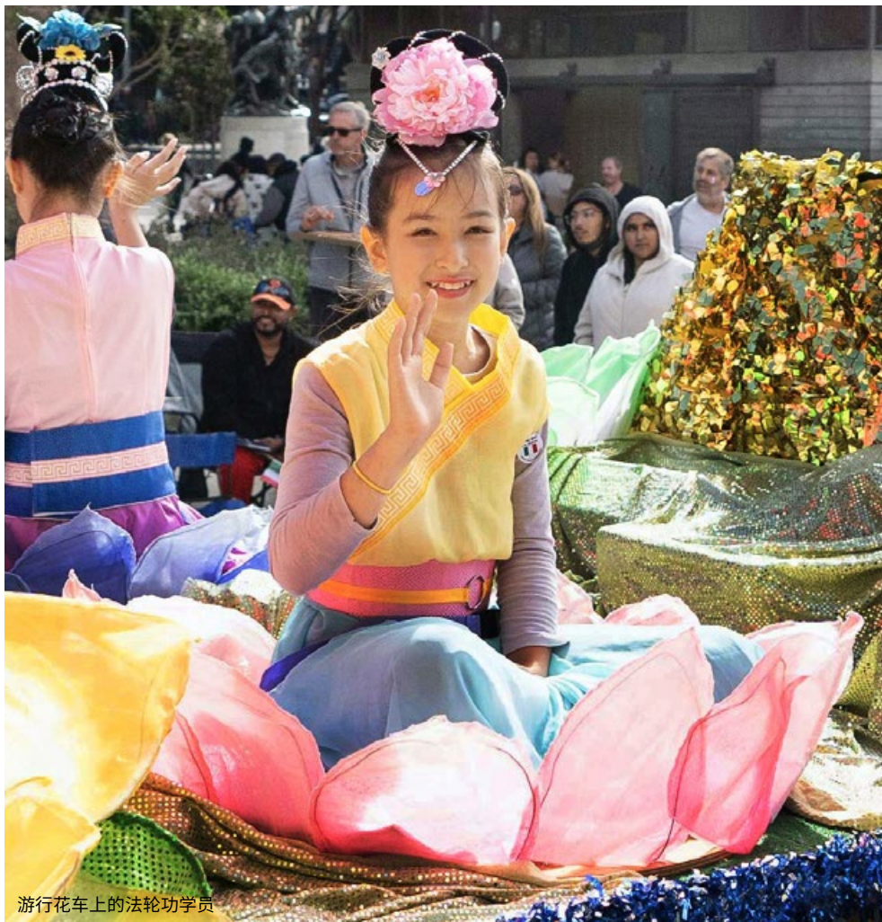
游行花车上的法轮功学员