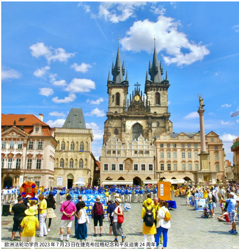
欧洲法轮功学员 2023 年 7 月 23 日在捷克布拉格纪念和平反迫害 24 周年