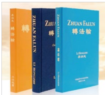
指导修炼的书籍《转法轮》

法轮功也称法轮大法，是李洪志先生于1992年5月传出的佛家上乘修炼大法，以真善忍为根本指导，按照宇宙演化原理修炼。亿万人的修炼实践