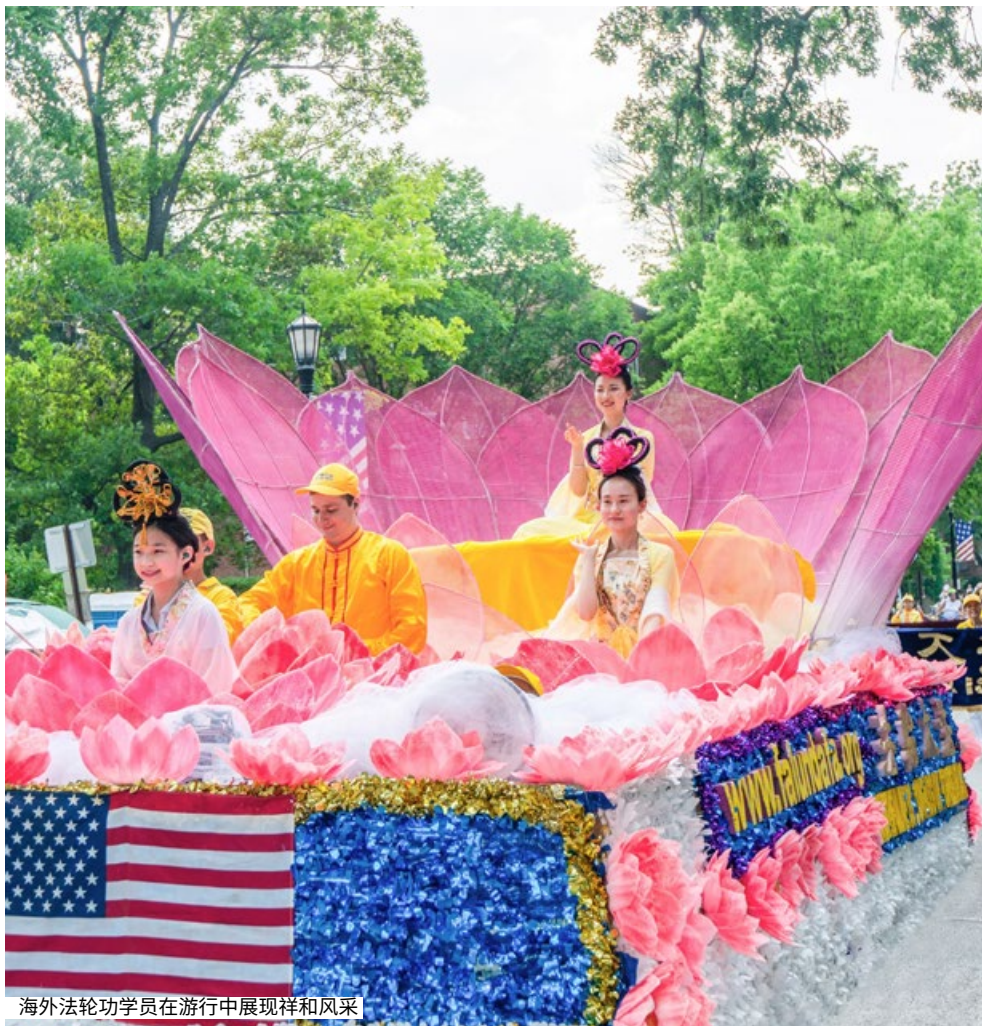
海外法轮功学员在游行中展现祥和风采