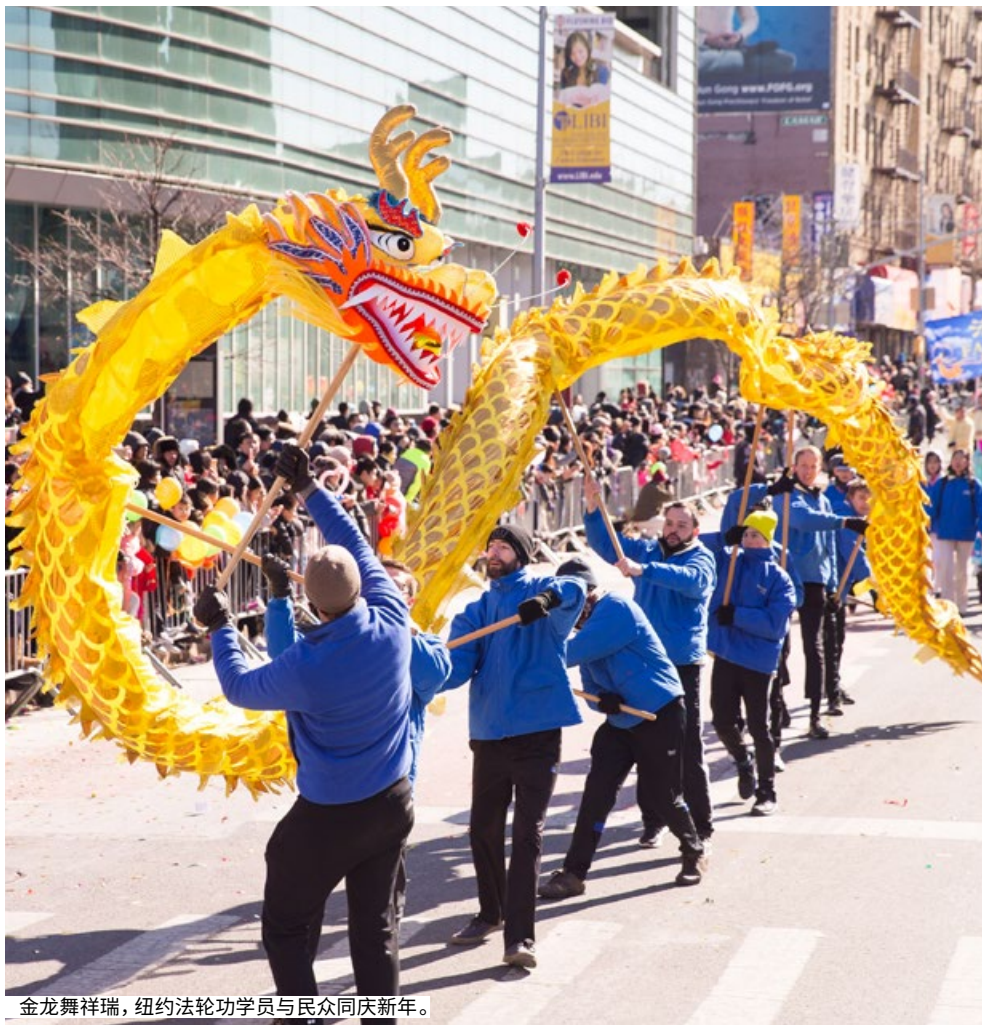
金龙舞祥瑞，纽约法轮功学员与民众同庆新年。