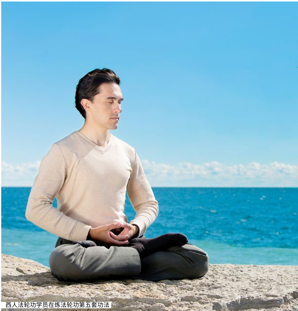
西人法轮功学员在炼法轮功第五套功法