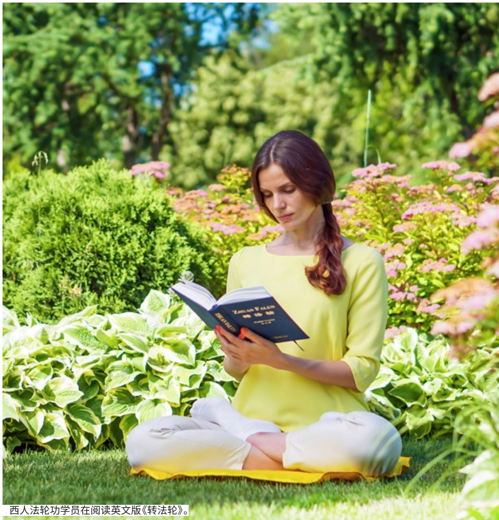
西人法轮功学员在阅读英文版《转法轮》。