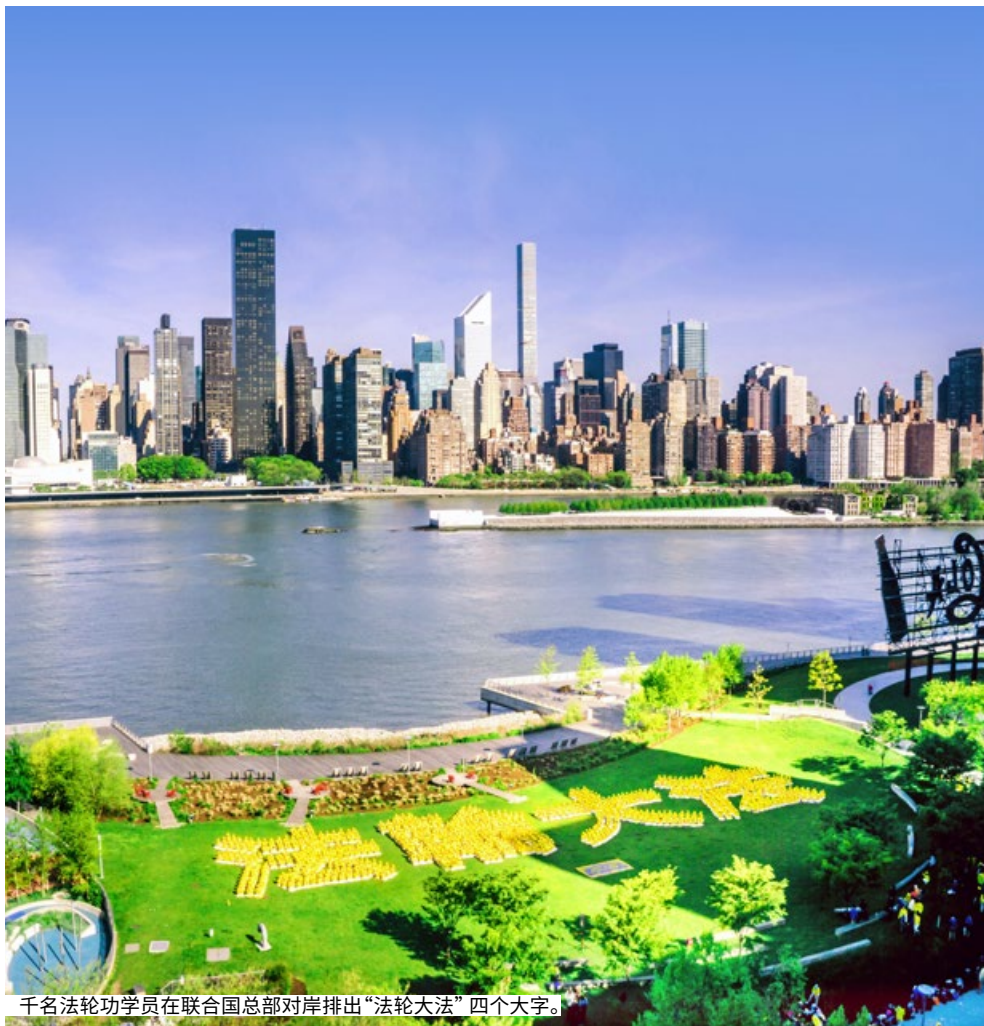
千名法轮功学员在联合国总部对岸排出“法轮大法”四个大字。