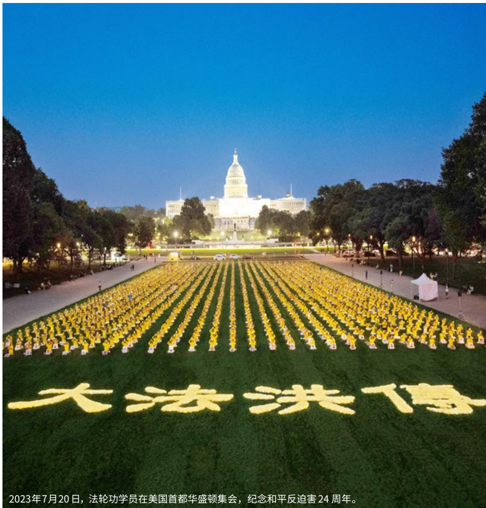
2023年7月20日，法輪功學員在美國首都華盛頓集會，紀念和平反迫害24周年。