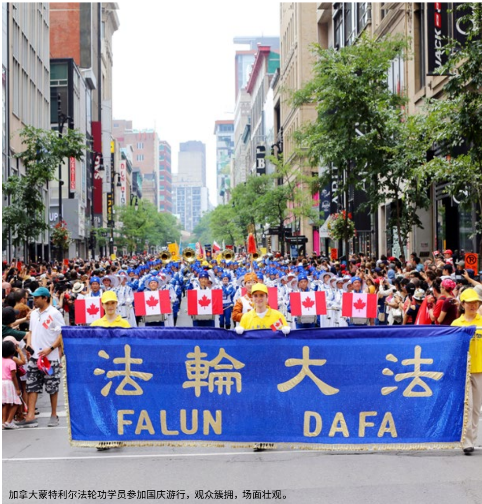
加拿大蒙特利尔法轮功学员参加国庆游行，观众簇拥，场面壮观。