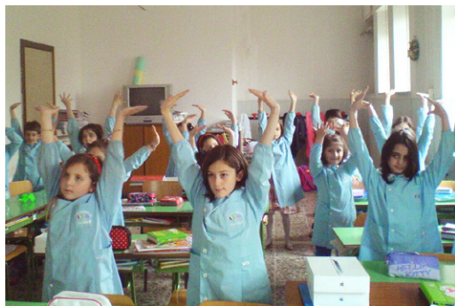
法轮大法弘传世界，多国学生学炼法轮功。图为意大利小学里的孩子们在炼功。