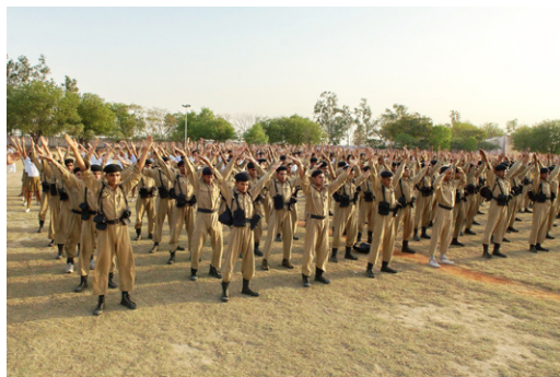
印度首都德里警察训练大学里，上千名师生在炼法轮功功法，洋溢着祥和之气。