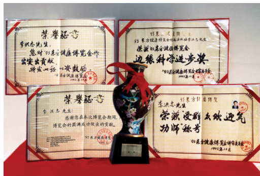
1993年北京东方健康博览会,李洪志大师获最高奖及最受欢迎的气功师称号。

俗话说:家风正,如沐春风;家风不正,祸患不远。人有德,必有福。——德,就是家族兴旺昌盛的根脉!