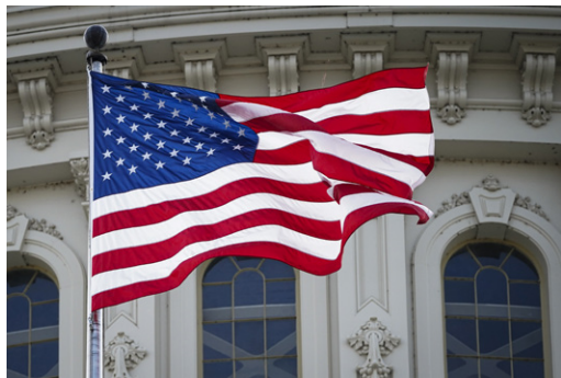
2023年5月13日，美国国旗在国会大厦飘扬，以此表彰李洪志大师的杰出贡献。

加拿大19个城市举行升旗仪式，对李洪志大师表达敬意。首都渥太华市长及议员在贺信中说：“真善忍的准则是受欢迎的教诲。感谢你们促进个人的身心健康，并为一个更和平、更和谐的世界而努力。”