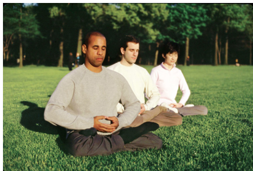
不同肤色的人们纷纷走入法轮大法修炼。他们共同的心声是：世界需要真善忍。