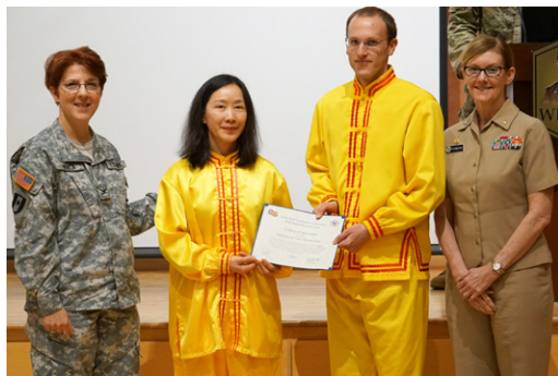
美国军队医学研究所向法轮功学员颁发褒奖，表达对李洪志大师的赞赏和钦佩。