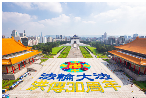
6000名法轮功学员在台北自由广场排出法轮图形及“法轮大法弘传30周年”字样。