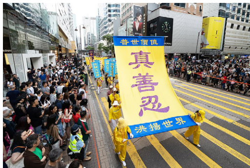
香港法轮功学员组成的游行队伍途经繁华街道,大批中外游客和市民夹道观看。