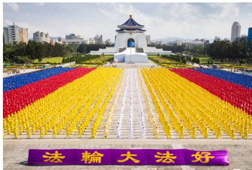
6000多名法轮功学员在台北自由广场集体炼功。台湾修炼者遍布社会各阶层。