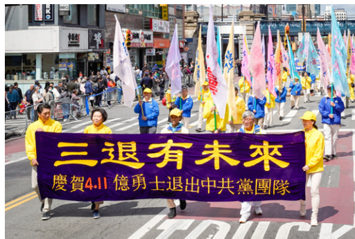
纽约庆祝“三退”游行。至2023年8月，在退党网站声明“三退”人数超过4.1亿。