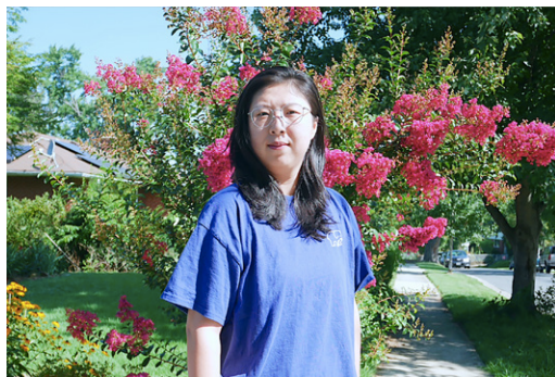
留学生南希：如果您能相信并诚念九字真言，就能体会到其中的幸运与美好。

研究和事实证明，九字真言，是能让人逢凶化吉、转危为安的“幸运诀”，他不只是表面的九个汉字，他具有宇宙法则的本质的内涵，携带着宇宙本源的纯正能量；他的发音带有宇宙特性的信息和洪大能量，诚念时，宇宙中强大的能量会传递到念诵者身上，可以祛除各类病毒；抑制、根除各种疾病；增强自身免疫力。《黄帝内经》中“正气存内，邪不可干”也是这个道理。