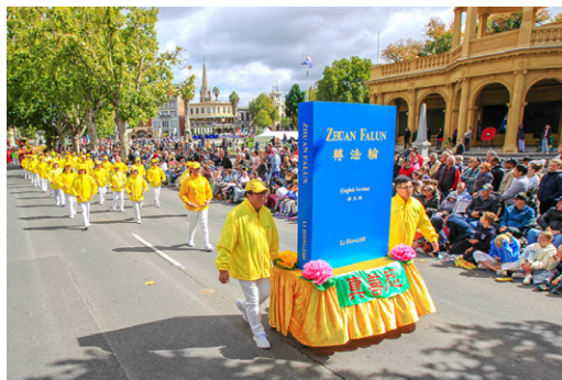
澳洲法轮功学员多次受邀参加各种庆典活动，被誉为“践行真善忍的模范团体”。

据联合国上世纪80年代的统计，被译成外国文字最多的中国名著是《道德经》，有30多种语言的译本。而传世仅30年的法轮功著作《转法轮》，有40多种语言的版本，是被翻译成外国文种最多的中文书籍。