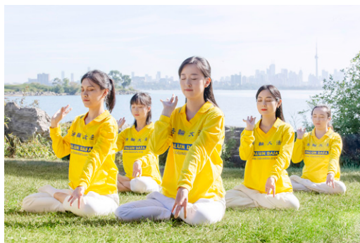
年轻的法轮功学员在加拿大景色迷人的湖边炼功。一本奇书让世界亿万人相遇。