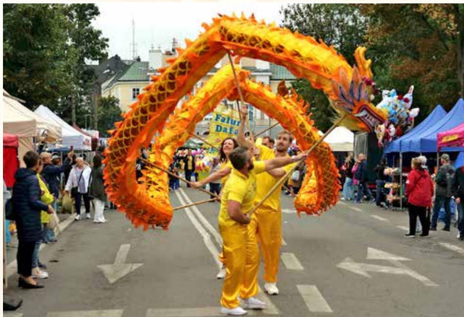
■ 西方法轮功学员的舞龙表演。下图为学员在花车上演示法轮功的功法动作。

金秋送爽硕果飘香。二零二四年九月十四日，波兰法轮功学员参加该国最大农业园艺中心斯凯尔涅维采 (Skierniewice) 市“鲜花水果蔬菜”丰收节游行，受到民众欢迎。