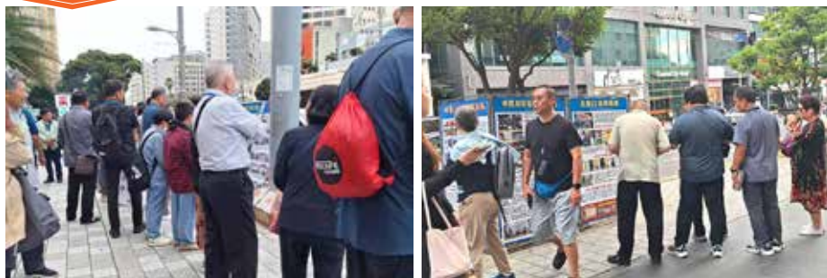
■ 乐天免税店前，中国游客们驻足阅读真相展板。

由于近来中国公民可以办理免签去济州的手续，因此到济州游玩的中国人特别多，占外国观光客的大部分，每天约有数千名中国游客乘坐飞机或豪华邮轮访问济州。如同很多世界各地著名的旅游景点都有法轮功真相点，美丽的济州岛成为韩国法轮功学员向中国民众展示真相的重要窗口，通过横幅、展板、游行和面对面交谈，让可贵的中国民众看到被中共封锁的重要信息。