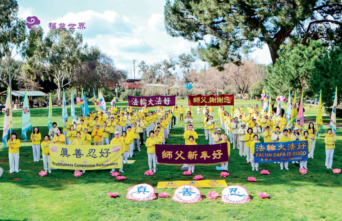
▲ 美国洛杉矶部分法轮功学员相聚一起，向李洪志师父送上新年祝福。