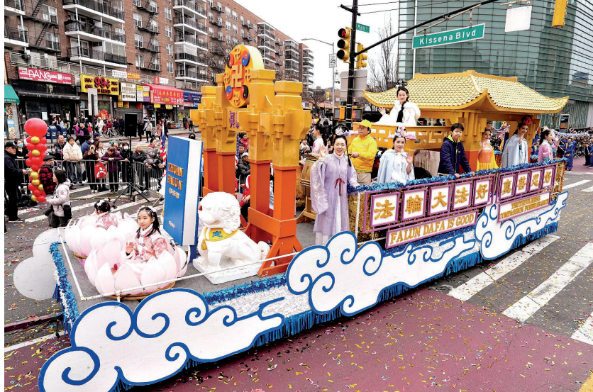
▲ 法轮功学员参加二零二四年纽约法拉盛中国新年游行。