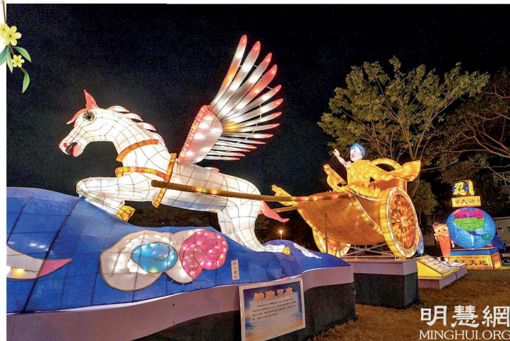
▲ 法轮功学员制作的《神驹天车》，多次参加台湾元宵节灯会。