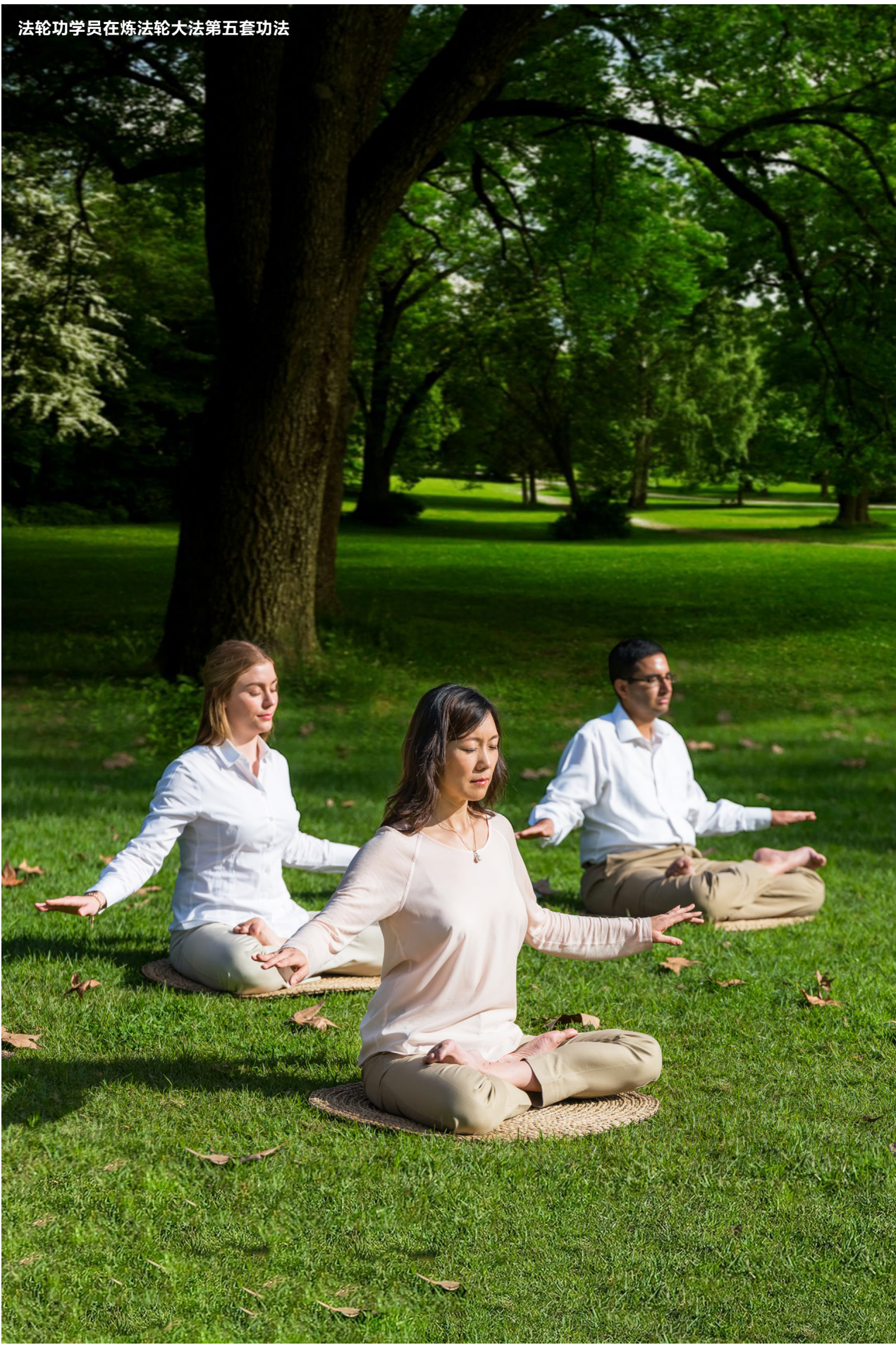
法轮功学员在炼法轮大法第五套功法