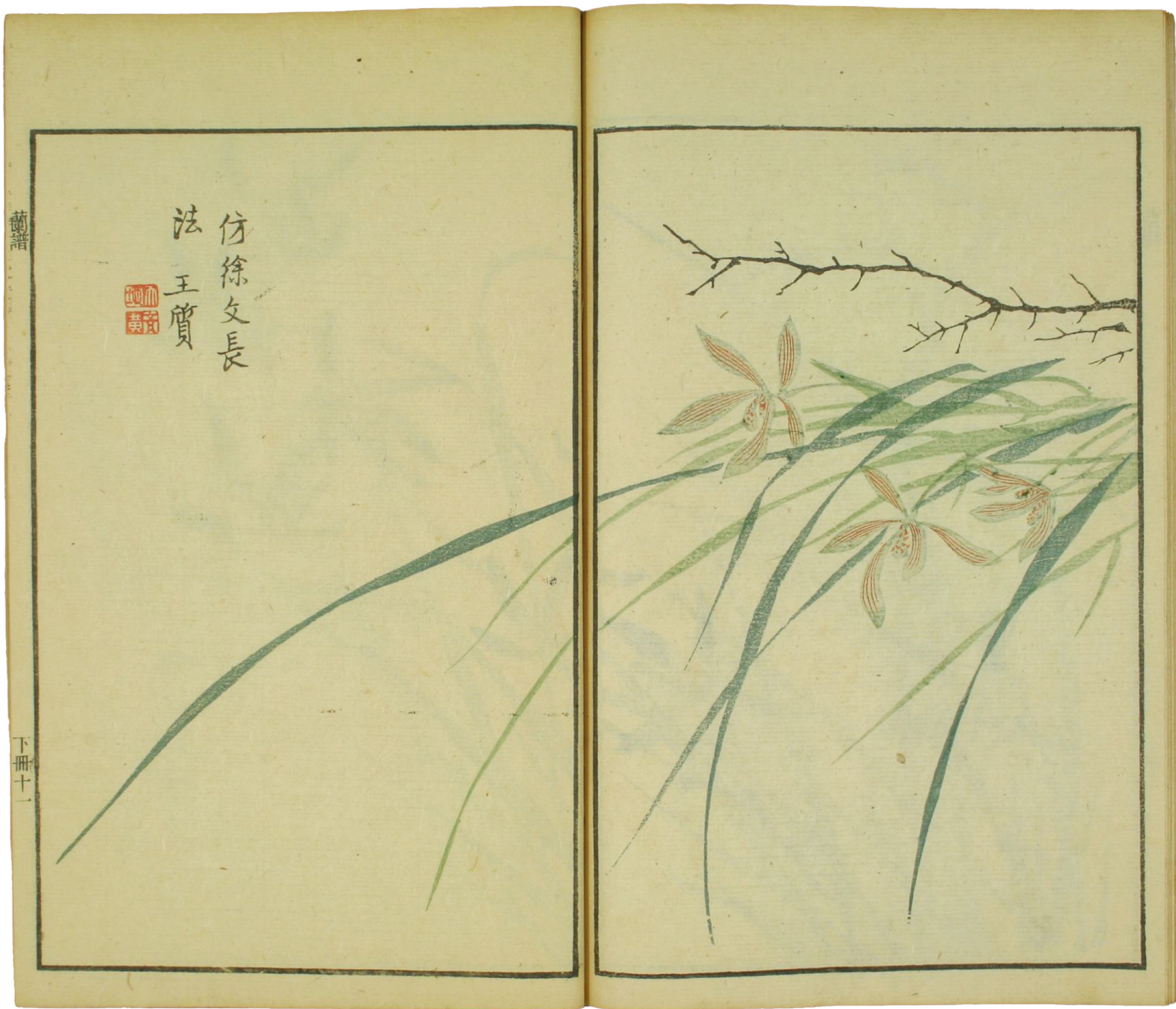
蘭譜「清」芥子園圖傳