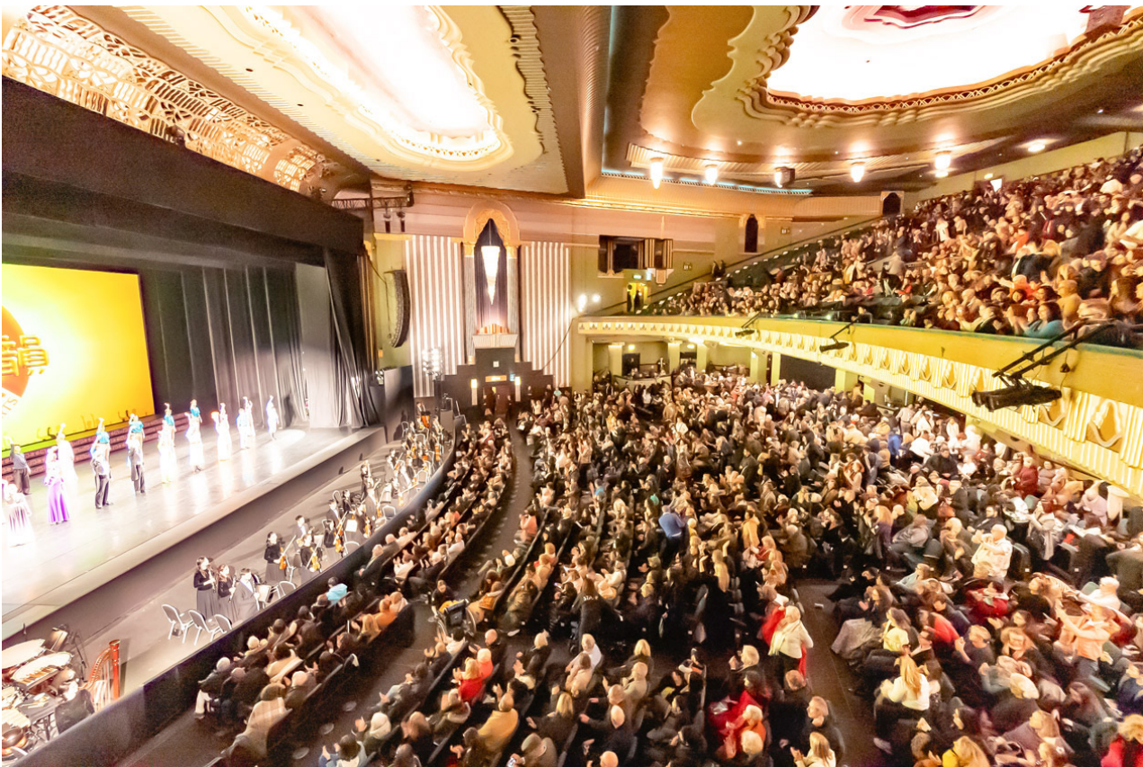
二零二四年一月二十六日晚，神韵新纪元艺术团展开了“2024演出季”在伦敦汉默史密斯阿波罗剧院（Eventim Apollo）八天十场演出的首场演出。演出至今场场爆满。图为二十七日演出的现场盛况。