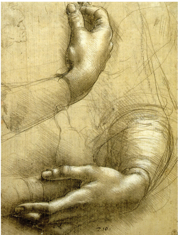
手的研究 素描 [意大利] 达·芬奇 约1474年

有人或许会说：这个技术还分什么邪党的与非邪党的吗？没错，是要分的，而且很分明。尤其是在艺术这个领域中，技法直接体现精神。同样都是写实绘画，前苏联的、中国的作品与西方传统绘画的画面效果区别就很大，非常直观。这