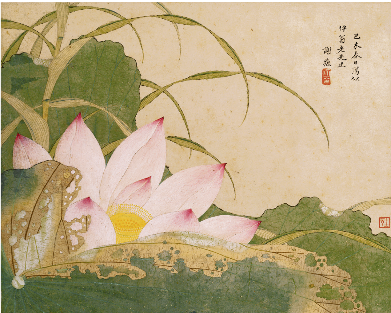
荷花图 纸本 设色 35x43.5厘米 [清] 谢荪 故宫博物院藏

深居俯夹城，春去夏犹清。 天意怜幽草，人间重晚晴。 并添高阁迥，微注小窗明。 越鸟巢干后，归飞体更轻。