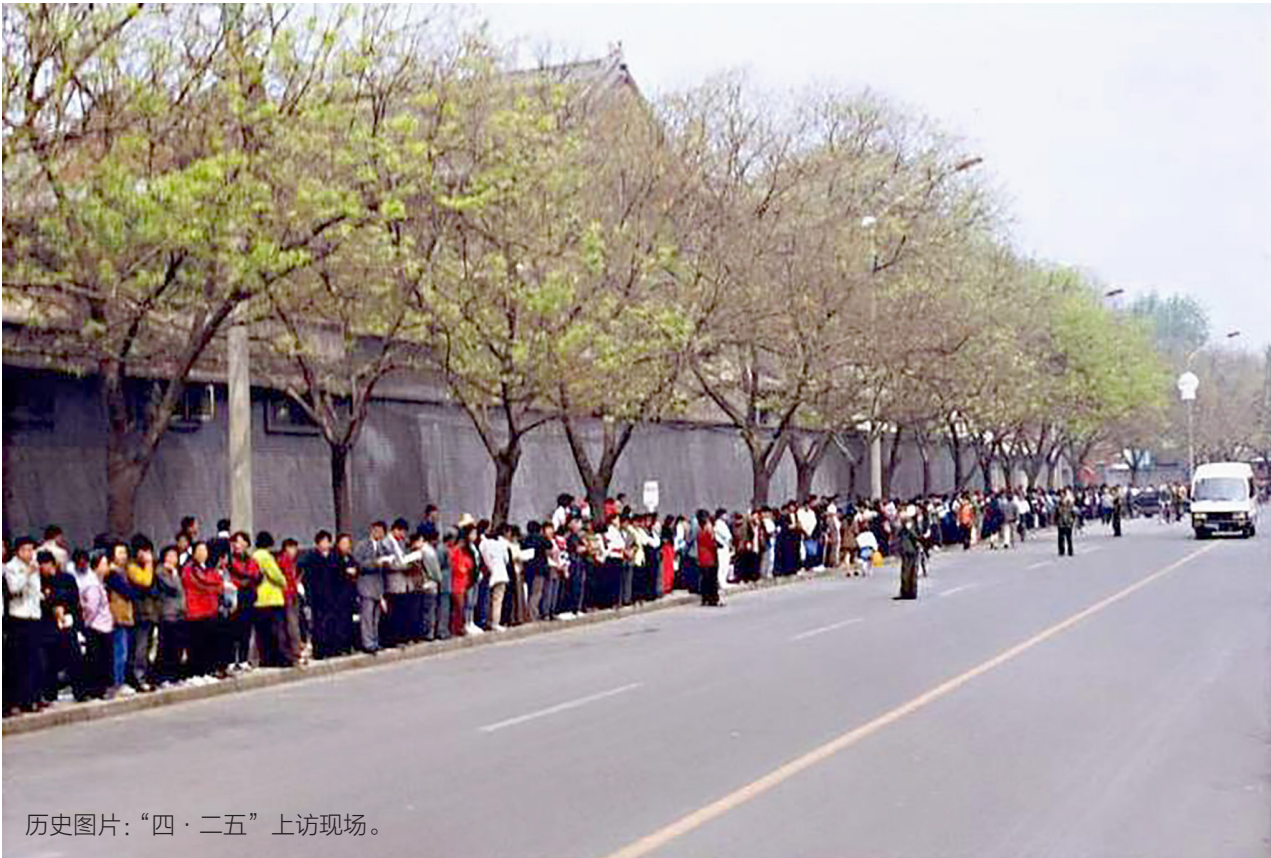
历史图片：“四·二五”上访现场。

相比之下，二十五年前的“四·二五”上访人群，衣着朴素整洁，言行平和自律，所站之处，尽量不给他人添麻烦，还自