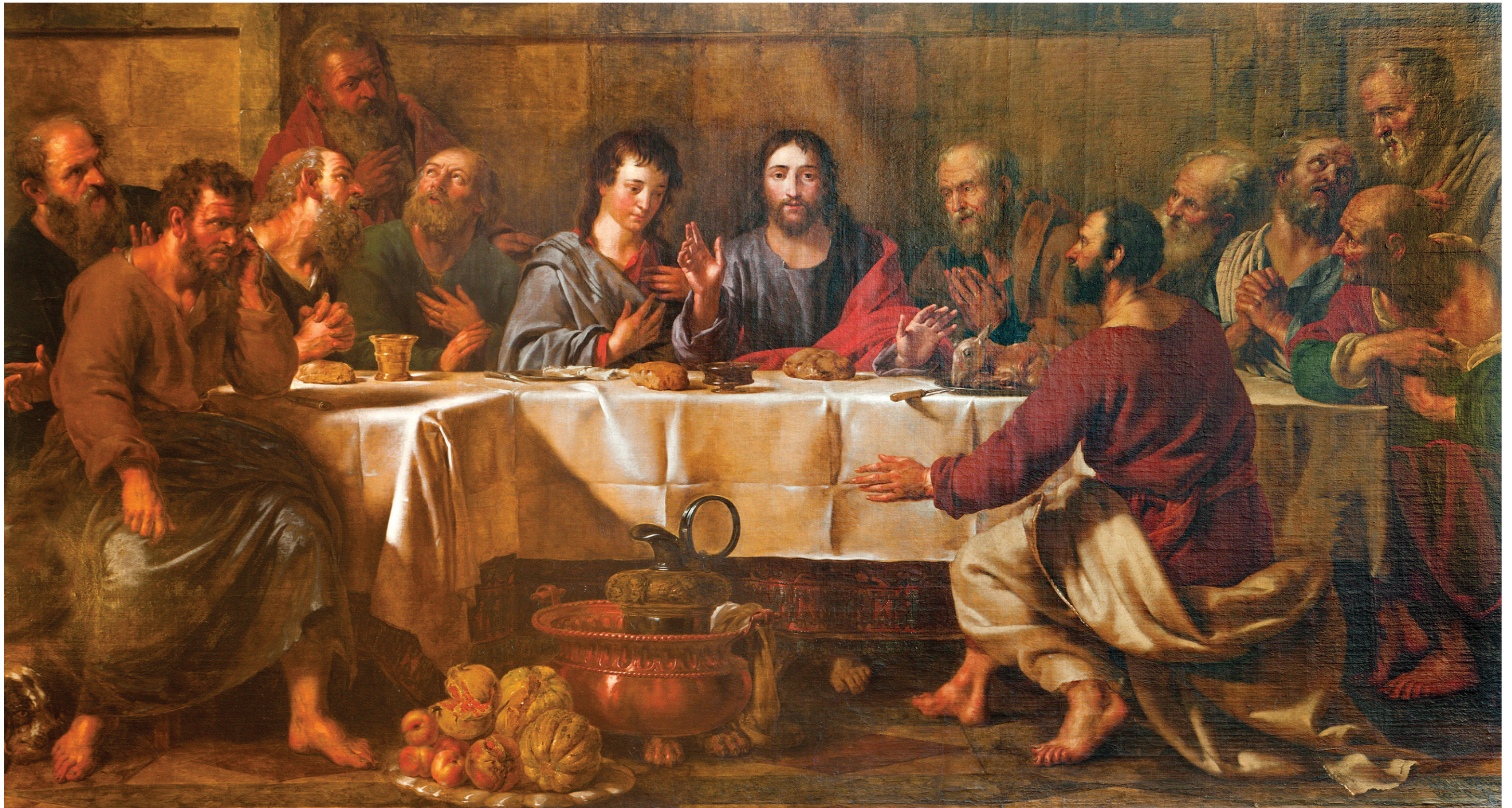
最后的晚餐（局部）壁画 [意大利] 米开朗基罗 西斯廷教堂