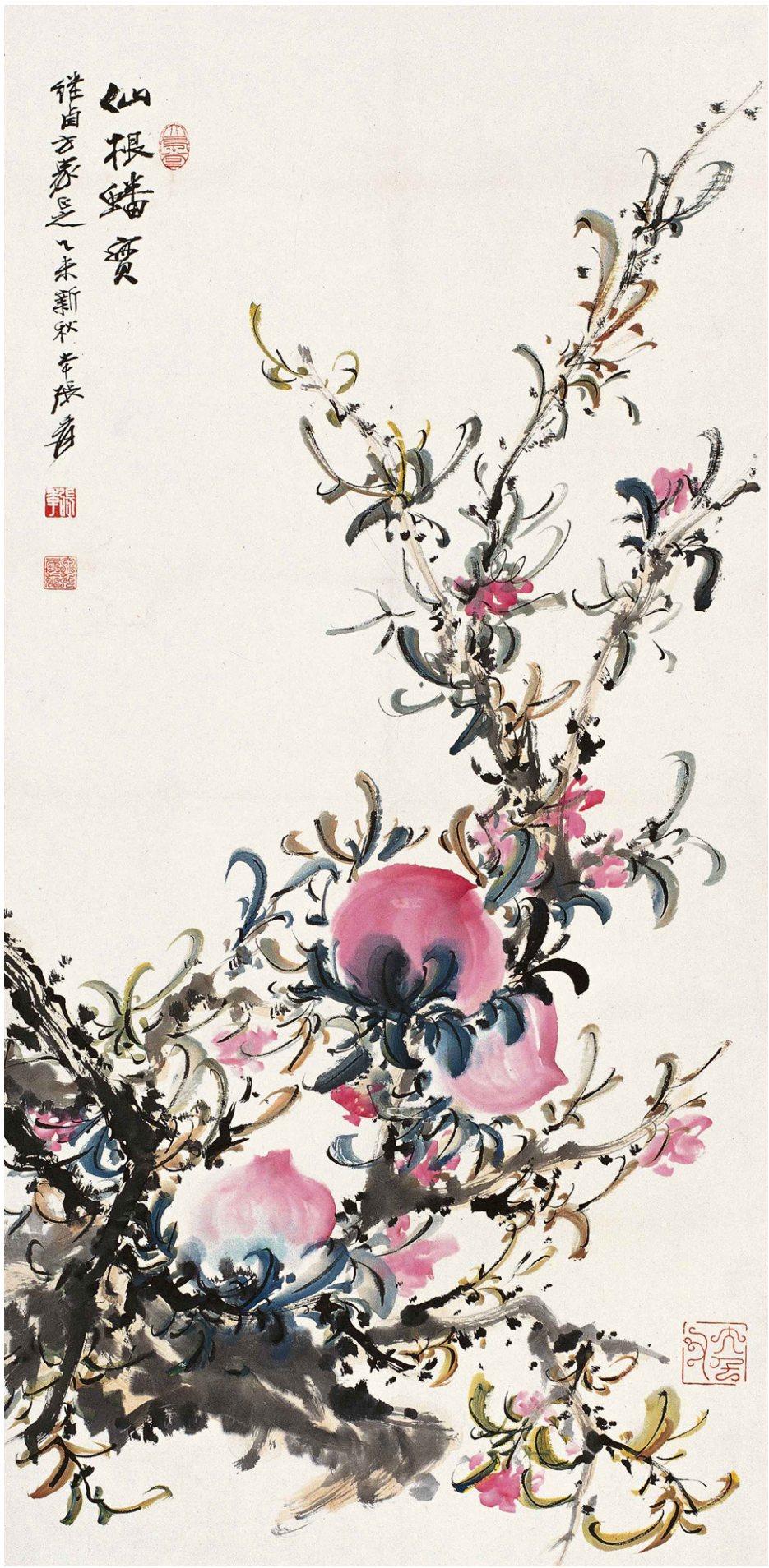
仙根蟠实图 纸本 设色 [民国] 张大千 1955年

咱家的百岁老人这样精神抖擞、神采奕奕，这不但是他的福气，也是我们子女的福气啊，都是托法轮大法的福。谢谢李洪志师父。🔴