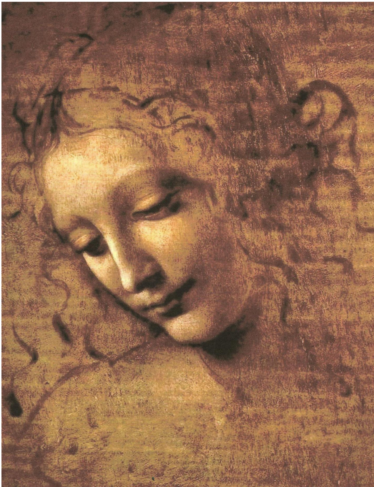
少女头像 素描 [意大利] 达·芬奇 1508年