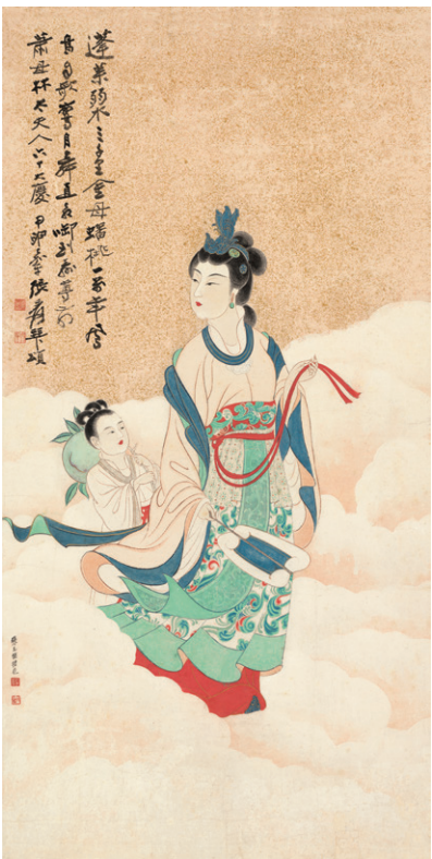
蟠桃献寿 [民国] 张大千 1945年

有时百岁的父亲一觉醒来，会说自己要走了，要到阴间去了。有一次，父亲出现重感冒症状，家人都以为他这次不行了。当时父亲的鼻子都有点歪了，好像面相都有点变了。可病了两天之后，父亲突然大声高喊：“法轮大法好！真善忍好！”家人都感到震惊，不知究竟。可是就这么一喊，渐渐地那些症状全没了，父亲再次不治而愈了！