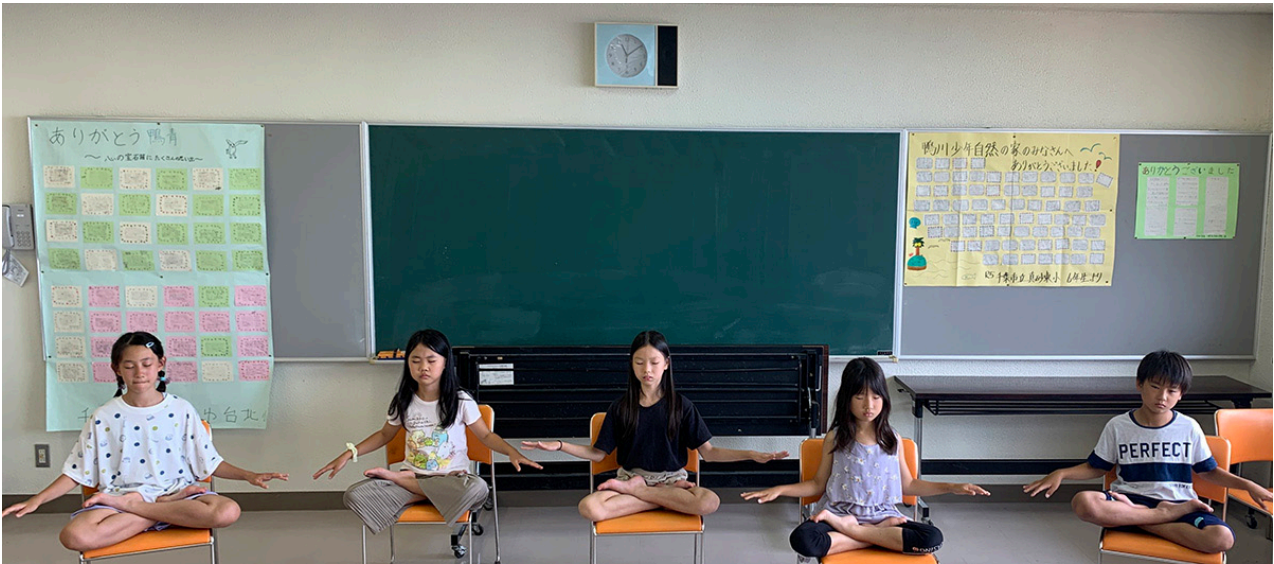
日本大法小弟子在炼功