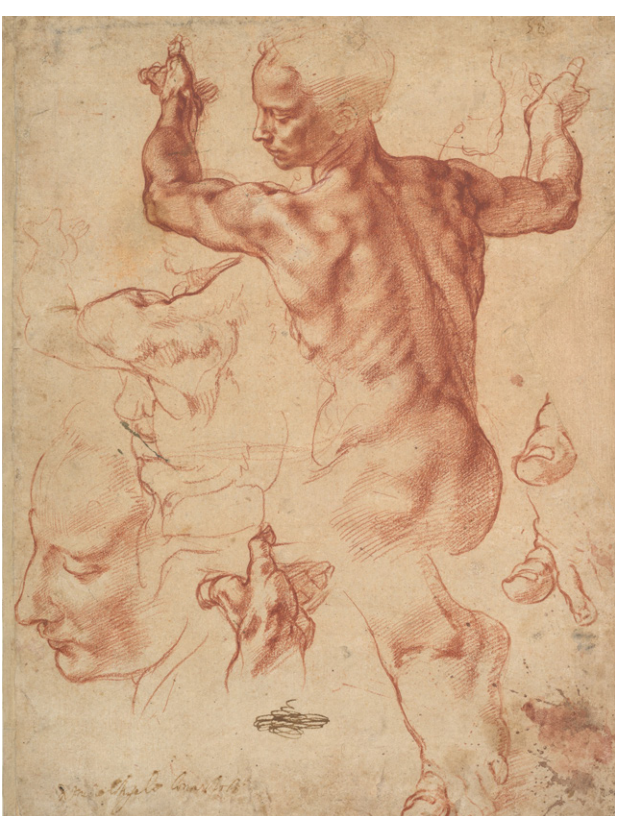
利比亚女先知草图 [意大利] 米开朗基罗 1510年-1511年

如果学画只是为了自娱自乐或陶冶情操，想必不会有那么多的家庭花费大笔的金钱与时间让他们的子女接受正规的科班教育，购买昂贵的画材，不分寒暑地苦练绘画技术。无疑，这一切的投入都是为了能在美术高考中拿到分数，考入或许能给子女带来梦想中大好前途的美术院校——当然，这也是建立在具备无视“毕业就是失业”这一客观现实的“优秀”心理素质之上的。基于这种