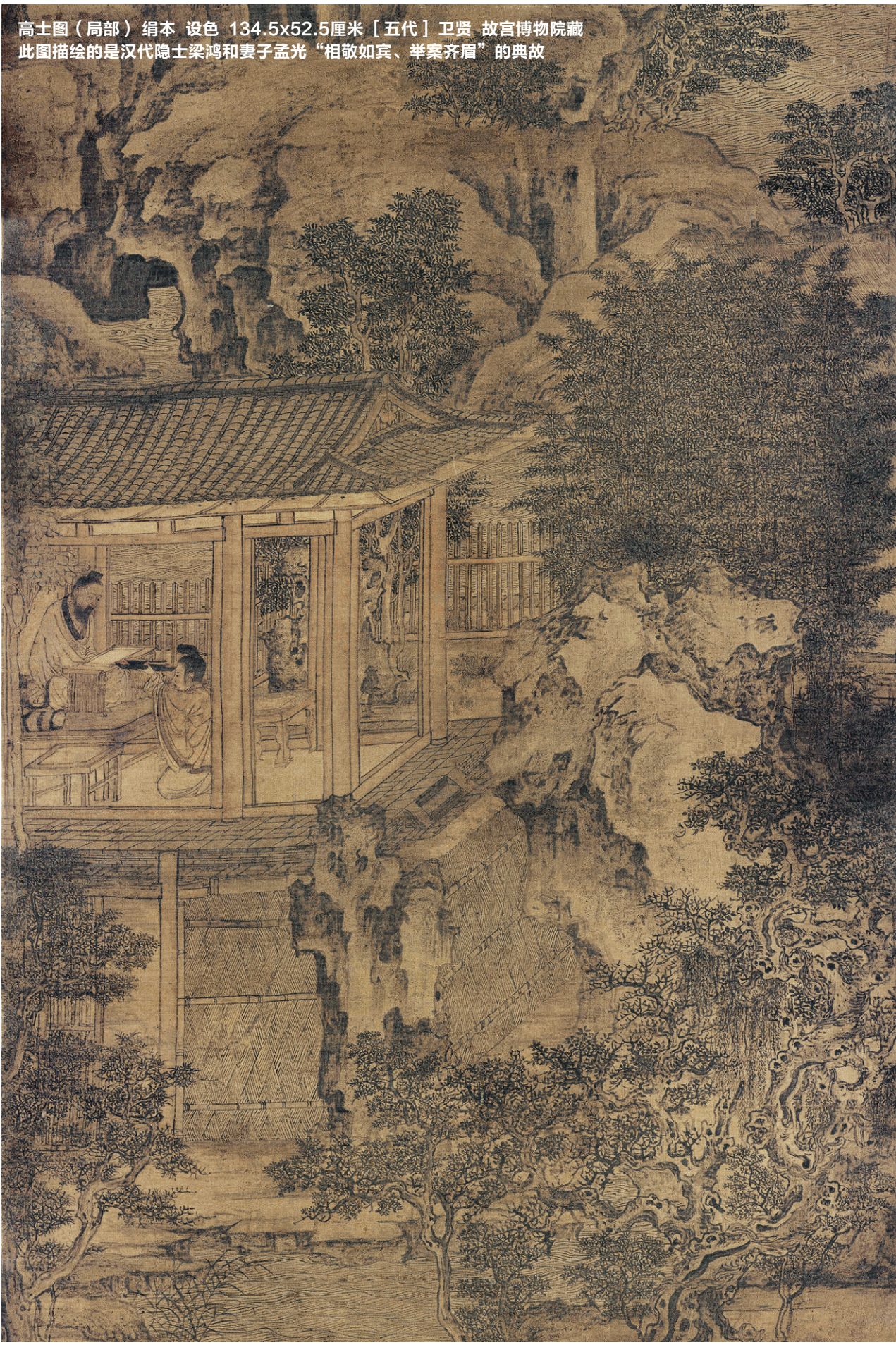
高士图（局部） 绢本 设色 134.5x52.5厘米【五代】卫贤 故宫博物院藏 此图描绘的是汉代隐士梁鸿和妻子孟光“相敬如宾、举案齐眉”的典故

十八年来，王宝钏的生活极度困窘，丈夫杳无音讯，自己孤苦无依，饥寒交迫。但是她坚守婚姻的誓言，坚信夫妻一定会团聚。凭借坚定不移的信念，王宝钏终于等到了薛平贵归来。她也苦尽甘来，和丈夫相伴余生。❶