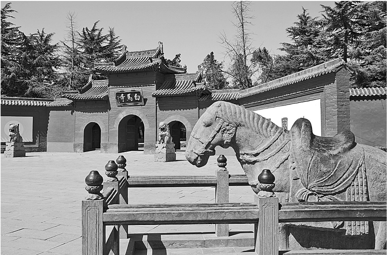
1966年5月文革爆发，河南洛阳白马寺一千多年前的辽代十八罗汉泥塑、两千年前印度高僧带来的贝叶经、稀世珍宝玉马、佛像、经卷被破坏，寺庙也差点被烧掉。

祖先上供。孩子冻饿嚎哭，男人打老婆，女人哭骂……除了上面派人贴的红纸标语，村里一点过年的气氛也没有。