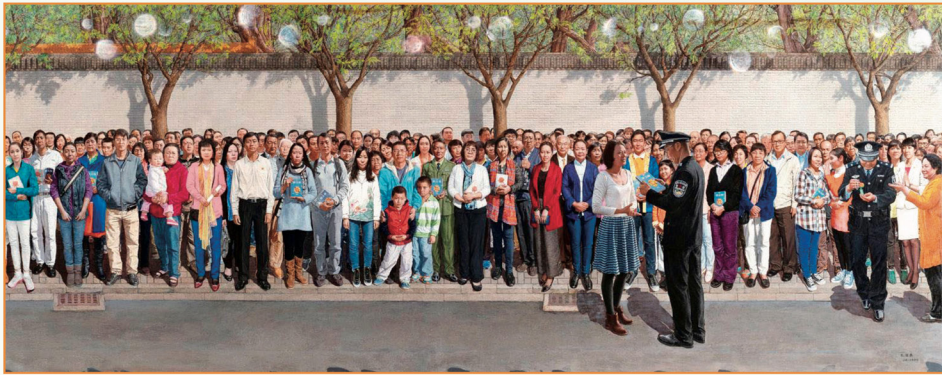
▲ 유화 '1999년 4월 25일'(일부) 1만 명의 파룬궁 수련생들이 베이징의 국가 민원 판공실에 평화적으로 청원하며 정부에 국민의 신앙 자유를 보호해 달라고 촉구하는 역사적 장면을 사실적으로 재현한 작품이다.