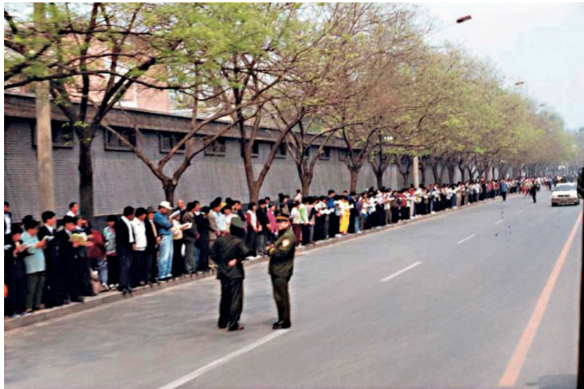
▲1999년4월25일, 베이징에서 만 명의 파룬궁 수련생이 평화롭게 청원하는 역사적인 사진