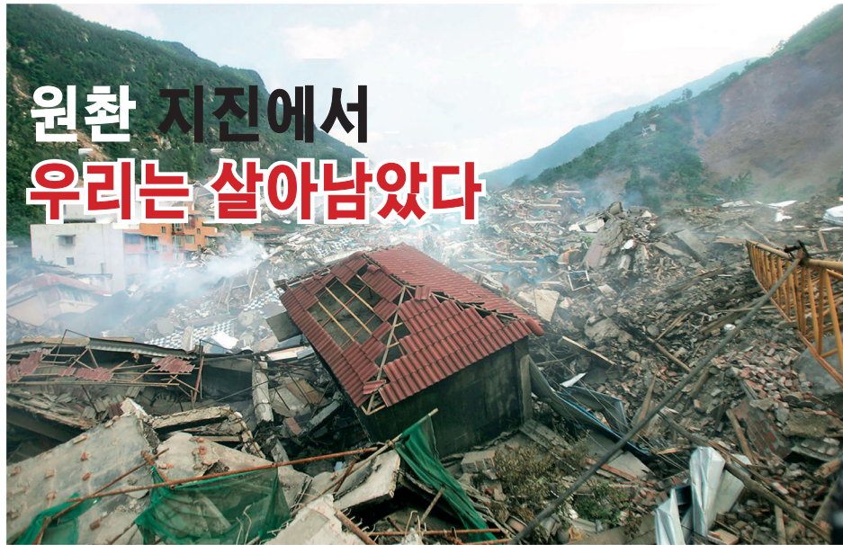
▲2008년 5월 14일, 스촨성 베이촨현은 대지진 이후 집들이 무너져 폐허가 되었다.

[스촨 투고] 2008년 5월 12일, 원촨 대지진이 일어난 날 나는 산속에서 티베트 이주 노동자들을 위해 요리를 하고 있었다. 오후 2시가 넘어서 점심을 먹고 책 몇 페이지를 읽다가 잠이 들었다. 한 남자가 “지진이 났는데 아직도 자고 있네!”라고 말하는 꿈을 꾸었다. 일어나자 침대가 기울어진 것을 보고 재빨리 화로를 평평한 바닥으로 끌어당겼다.