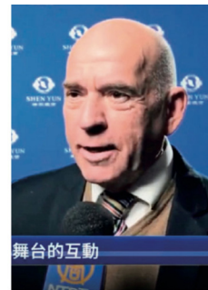
▲ 덴마크 선원 의원 센 에스페르센

2024년 4월 6일부터 14일까지 미국 뉴욕에서 선원 공연이 14회 전석 매진을 기록했다. 뉴욕 링컨 센터는 ‘세계 1위 공연’인 선원의 흥행 기적을 다시 한 번 목격했다.