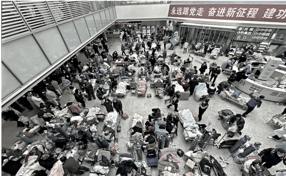
▲ 2023년 1월 13일, 상하이의 한 병원 정원의 한가운데도 병상으로 가득 찼다. 병원 벽에는 ‘항상 당을 따라가다’라는 글귀가 적혀 있었다. 한 네티즌이 “공산당을 믿고 화장터로 달려가라”고 말한 것은 당연한 일이다.