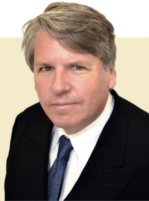
▲ 미국 실리콘밸리 유명한 기업가 크리스·키츠.

실리콘밸리의 기업가인 크리스·키츠는 여러 첨단 기술 기업의 창립자이자 회장, 파트너로 지난 30년 동안 수십억 달러가 넘는 시가총액을 자랑하는 회사를 만들어냈다.