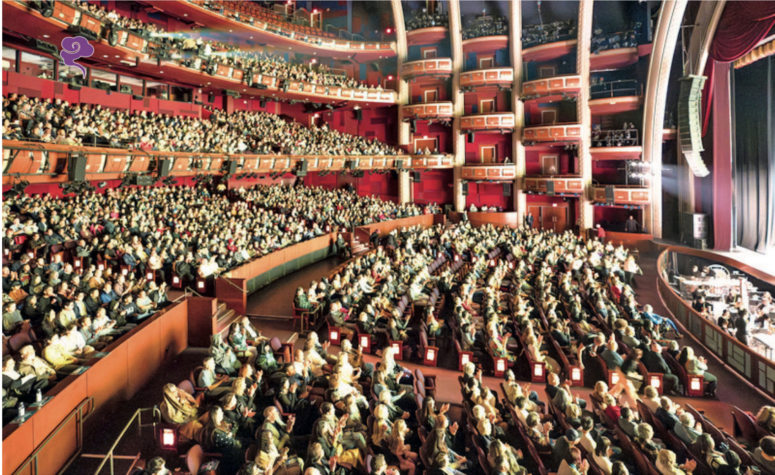
▲ 미국 로스앤젤레스 할리우드 돌비 극장, 선원 공연으로 만석을 이루었다.