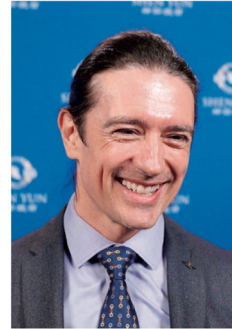
▲ 할리우드 스타 아담 크로스텔

어느 날 그는 성철 스님이 수행하시던 곳에 한번 가고 싶다는 생각에 대구 성전암에 갔다가 그곳에서 한 불교 신도로부터 파룬궁(法輪功) 수련이라는 뜻밖의 이야기를 듣게 됐다.