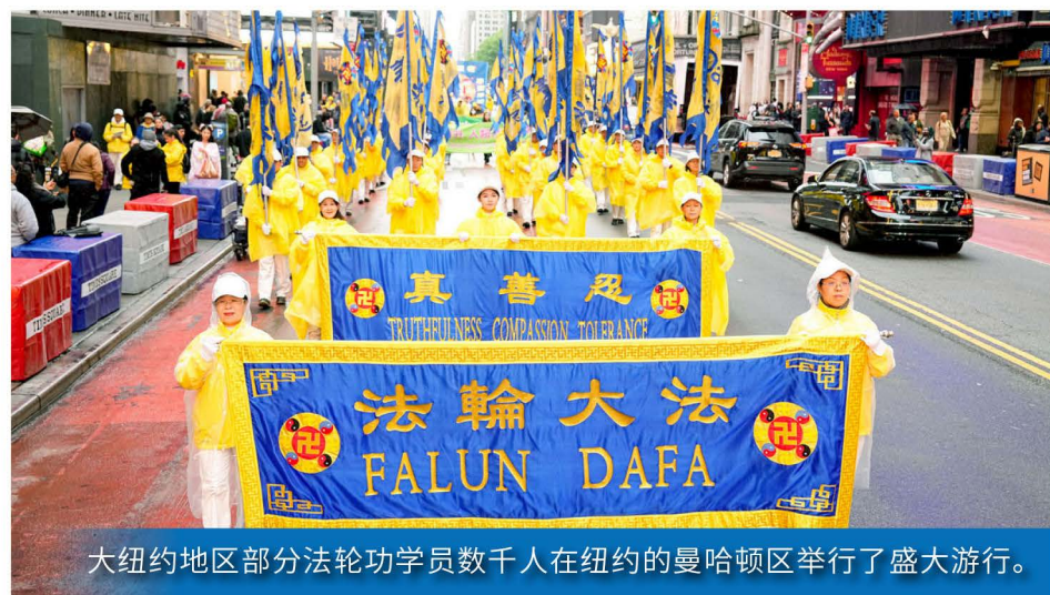
大纽约地区部分法轮功学员数千人在纽约的曼哈顿区举行了盛大游行。

轮大法洪传于世32周年，表达对法轮大法创始人的感恩，向民众传递法轮大法的美好，希望更多人能获益。成千上万的法轮功修炼者都在大法中获得了健康的身体和心灵的升华。