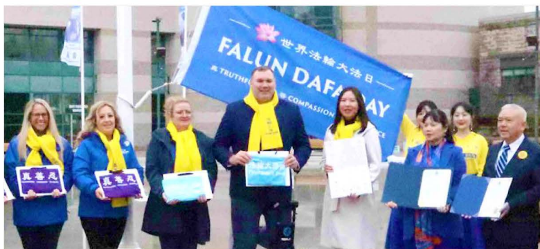
▲ 亚历克斯市长（中）及当地议员代表与法轮功学员合影。

同时，他还呼吁积极维护人权，结束中共对法轮功的迫害。他说：“各个国家都能自由修炼法轮大法，在公众场合学炼。唯独中共不让炼法轮功，存在重大的问题。我正告中共——停止对法轮功学员的迫害。”