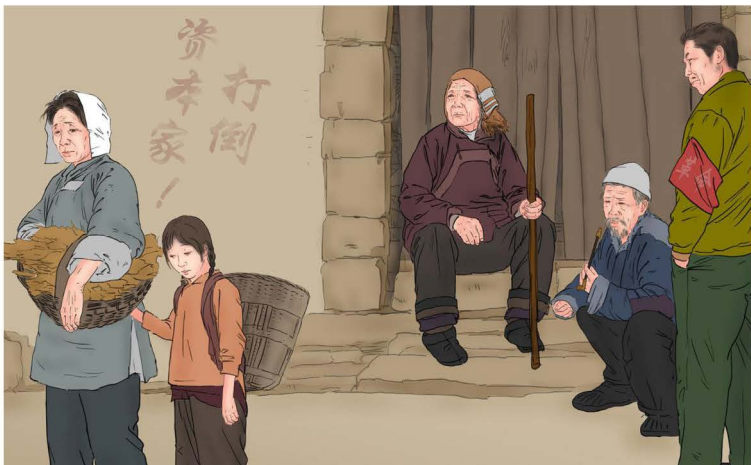
▲ 中共进行了一系列批斗活动，让中国人心中充满批判与恨。

1950年、1951年，中共进行了“土改”、“镇反”、“肃反”、“镇压反动会道门”（镇压宗教）。各种运动都杀了很多中国人。学校都要组织小学生参加批判会，让学生看“敲沙罐”（枪毙人），纯粹是进行恐怖训练。