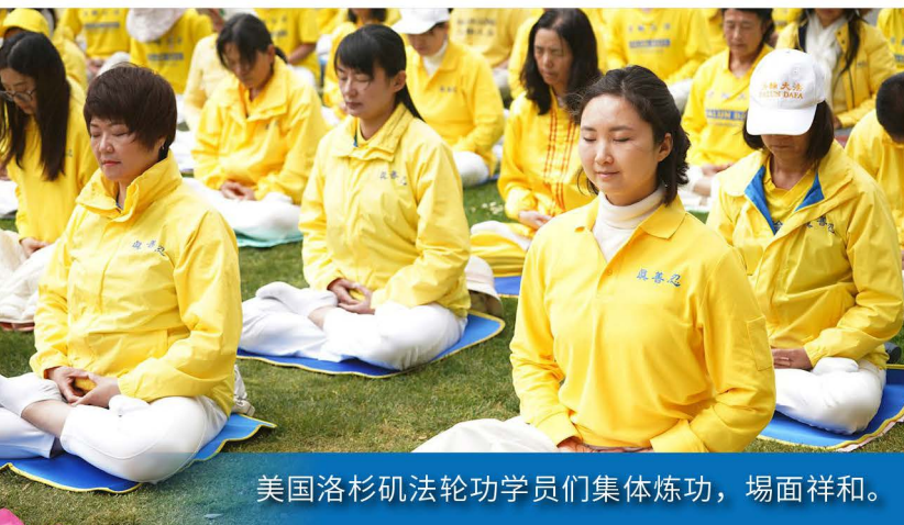
美国洛杉矶法轮功学员们集体炼功，场面祥和。