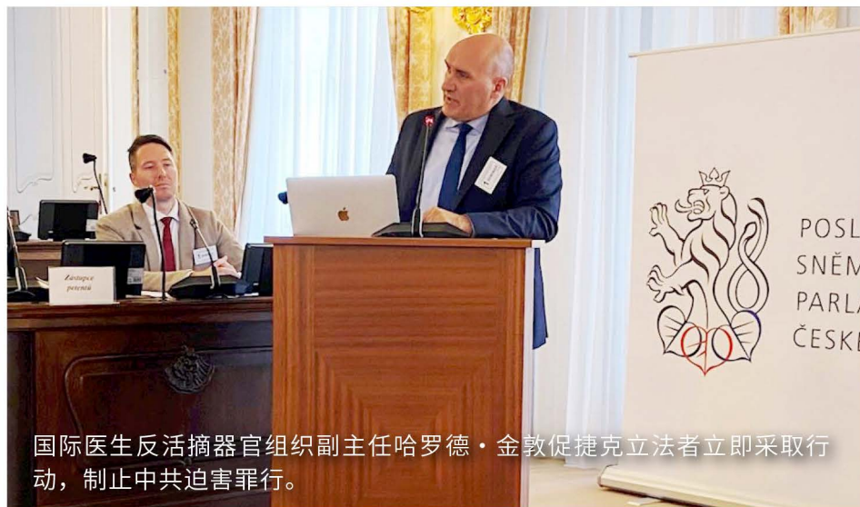
国际医生反活摘器官组织副主任哈罗德·金敦促捷克立法者立即采取行动，制止中共迫害罪行。