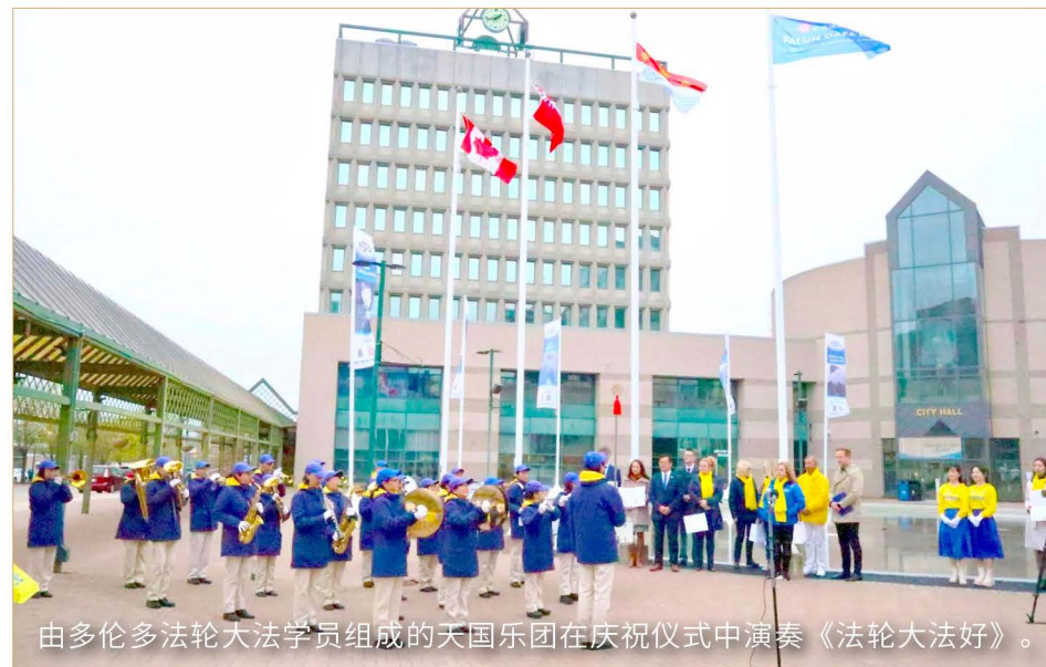
由多伦多法轮大法学员组成的天国乐团在庆祝仪式中演奏《法轮大法好》。

一天，我在小区里乘凉。有一个直不起腰的老头招呼我过去。我走到他跟前，他对我说：“老兄，你咋保养得这么好？气色这么好？”我说：“我不是保养得好，是炼法轮功炼得这么好。以前医院都说我不行了，都让家人准备后事了，是个快要死的人，可是炼法轮功炼好了。”那个老头说：“真的？那我炼也能炼好吗？”我说：“你炼你也能像我这样，不过你敢说一声‘法轮大法好’吗？”