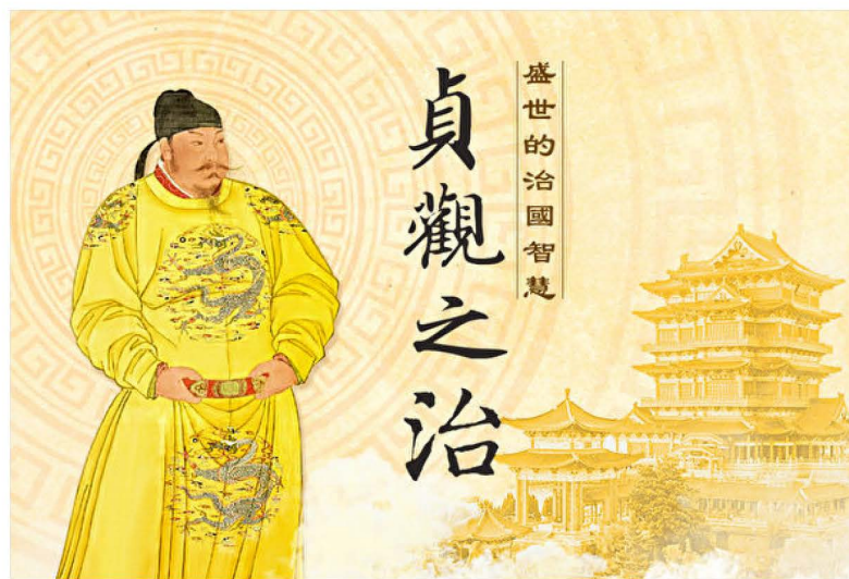
▲ 唐太宗李世民开创了“贞观之治”，在历史上写下了辉煌的一页。

怜悯心。此皆自己实受用处。若夫忌人之成，乐人之败，何与人事？徒自坏心术耳。古语云：‘见人之得，如己之得。见人之失，如己之失。’如是存心，天必佑之。”