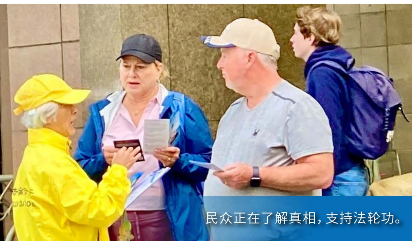
民众正在了解真相，支持法轮功。