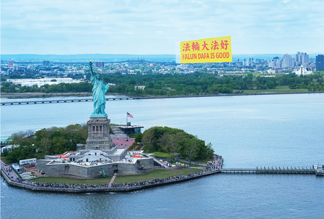
为纪念法轮大法传出于世间32周年暨5·13“世界法轮大法日”，5月13日，“法轮大法好”巨型横幅在哈德逊河上空放飞，飞越自由女神像。

放飞策划者之一的马修先生表示，牢记“法轮大法好”可给你的生命带来救度、福分与平安。中国大陆的法轮功学员为了告诉世人这句话，付出了很多，包括冒着生命危险（被举报、被抓捕、被诬陷、被坐牢、甚至被活摘器官）去印发法轮功真相资料、电视插播、印真相币、发放翻墙软件等等，为