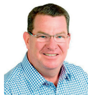
澳洲国会议员 Scott Buchholz