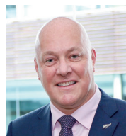
新西兰总理 Christopher Luxon

员朱迪·斯格罗（Judy Sgro）在世界法轮大法日庆祝活动中发言，她代表加拿大总理特鲁多和自由党团队向法轮功学员致以最诚挚的问候。她说：“我相信，修炼法轮功的人越多，我们作为个体就越健全完善，我们的国家也就越强大。”