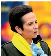
加拿大国会议员 Melissa Lantsman

美国明尼苏达州州长蒂姆·沃尔兹 (Tim Walz)、印第安纳州州长埃瑞克·霍科姆 (Eric Holcomb)、内布拉斯加州州长吉姆·皮伦 (Jim Pillen)、宾夕法尼亚州州长乔什·夏皮罗 (Josh Shapiro)，分别宣布二零二四年五月十三日为法轮大法日或表彰法轮大法。