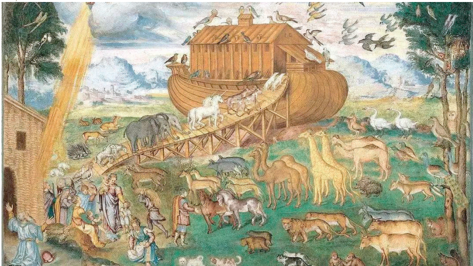
▲《圣经》中关于大洪水和诺亚方舟的记载广泛流传。