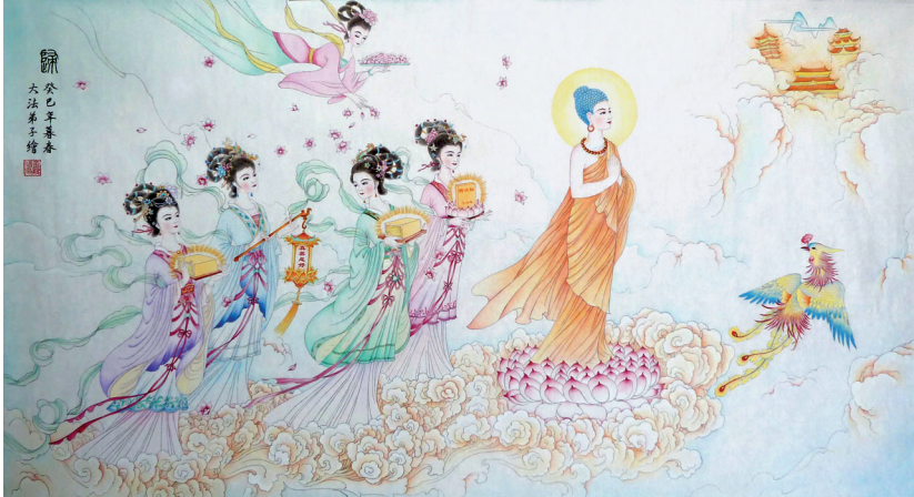
▲ 工笔画：《归》。作者：武汉大法弟子金缘