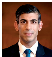
英国首相 Rishi Sunak

澳洲联邦议员斯科特·巴克霍尔兹（Scott Buchholz）表示：“法轮大法展现出的坚韧不拔的意志让生命得到了升华，并让我们的社会更加和睦。”