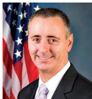
美国众议员 Brian Fitzpatrick

二零二四年五月十三日是第 25 届“世界法轮大法日”暨法轮大法洪传世界 32 周年纪念日。多个国家不分党派、数百名政要向法轮大法及其创始人李洪志先生颁发褒奖和贺信，赞扬“真、善、忍”原则和法轮大法对人类身心健康所作出的杰出贡献。