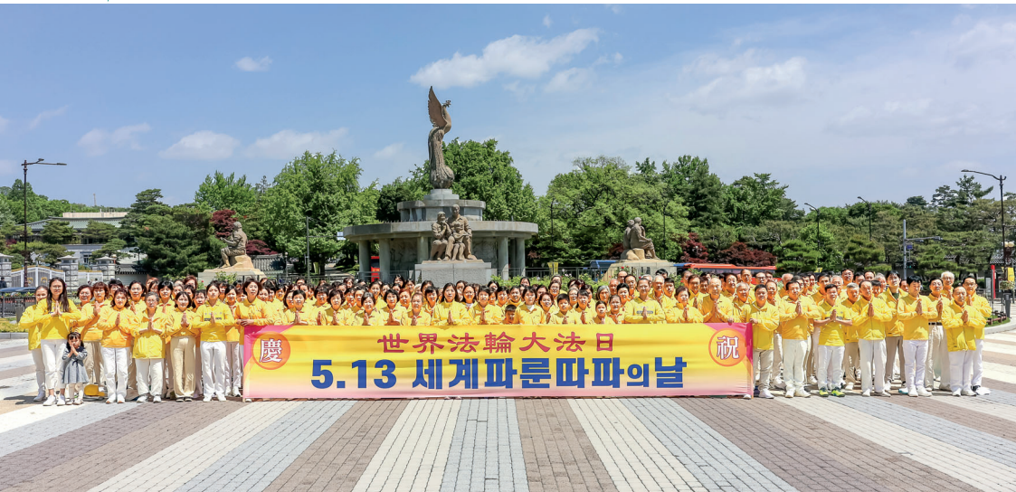
▲ 二零二四年五月十二日，韩国部分法轮功学员在青瓦台喷水台前集体炼功，庆祝 5.13 世界法轮大法日。