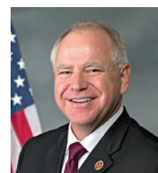
明尼苏达州州长 Tim Walz

日。随后，菲茨帕特里克议员将这面在美国国会大厦上空飘扬过的国旗和褒奖证书（如图一）赠予李洪志先生，“特此表彰法轮大法创始人李洪志先生将法轮大法洪传世界，并传播法轮大法的核心原则——‘真、善、忍’。您的教导，将继续激励世界未来的领导人，给他们带来信心。”褒奖证书写道。