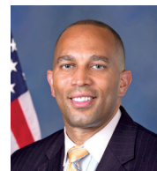
美国会少数党领袖 Hakeem Jeffries