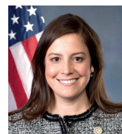
美国会多数党领袖 Elise Stefanik