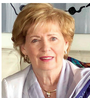
加拿大国会议员 Judy Sgro