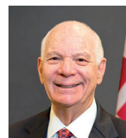
美参院外委会主席 Ben Cardin