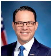
宾夕法尼亚州州长 Josh Shapiro