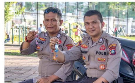
▲ 执勤的警察高兴地接过法轮大法真相资料。