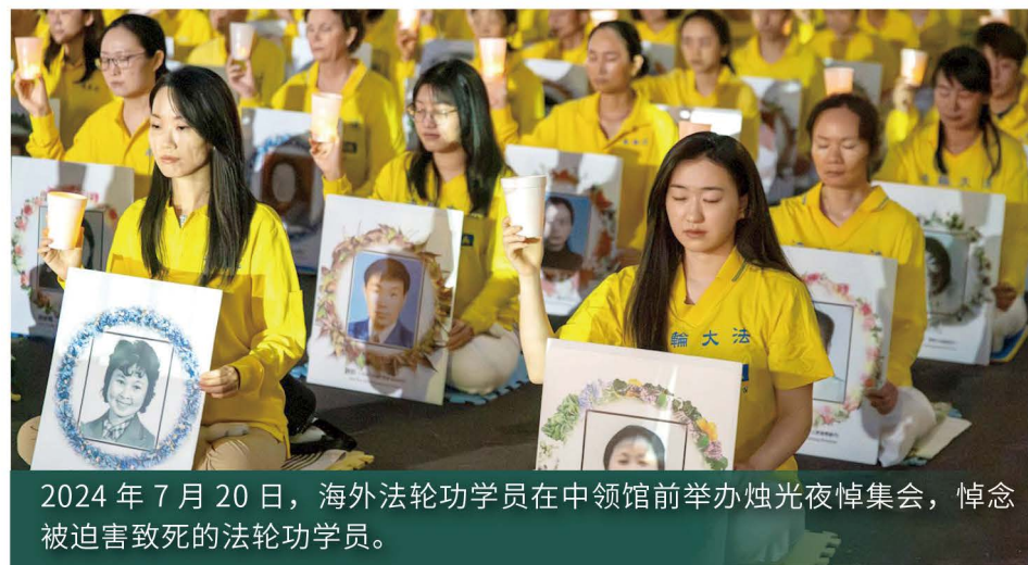
2024年7月20日，海外法轮功学员在中领馆前举办烛光夜悼集会，悼念被迫害致死的法轮功学员。

当丽美的心起了变化后，先生暴躁顽固的态度也跟着转变。“我发现家里大大小小的事情，先生开始揽起来默默地做。例如他会跟我说，冬天那么冷，我来洗碗就好。出门工作回到家，也发现先生把家里衣服洗好了、收好了，还折好放进每个人的衣柜了。他跟家人、朋友相处的状况也一直在改变，