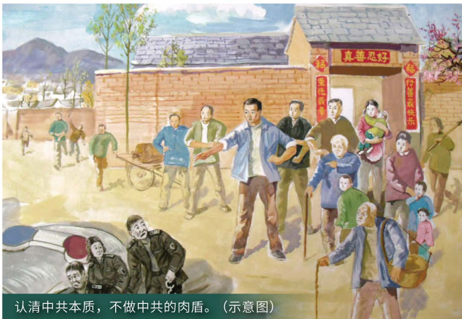
认清中共本质，不做中共的肉盾。（示意图）