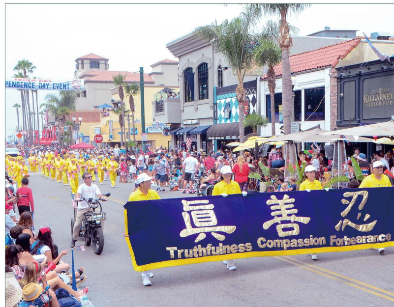
▲ 美国加州杭廷顿海滩市独立日游行中的法轮功学员的队伍。

还有一些法轮功学员沿途与民众互动。他们在欢庆美国国庆的同时，也希望把真、善、忍的普世价值带给更多人，并盼望仍遭中共迫害的大陆法轮功学员能早日获得信仰自由。■