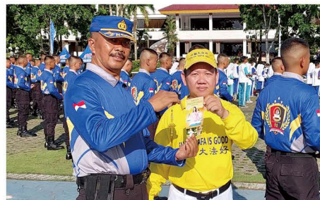
▲ 警督马沙希德（左）认为法轮大法可以给日常生活带来积极的影响。

学生参加了下午的活动。警督马沙希德与学员进行了长时间的交谈。他说：“法轮功功法简单易学，也不费力，无论年纪如何，都可修炼。非常有利于陶冶身心，可以给我们的日常生活带来积极的影响。这是我观看今天活动后的感受。”