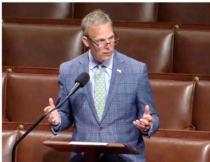
▲ 国会众议员佩里在投票前发言。