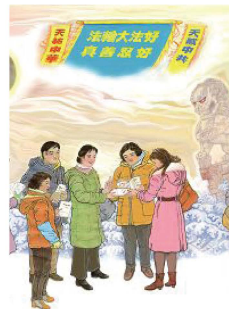
▲ 诚念九字真言保平安。