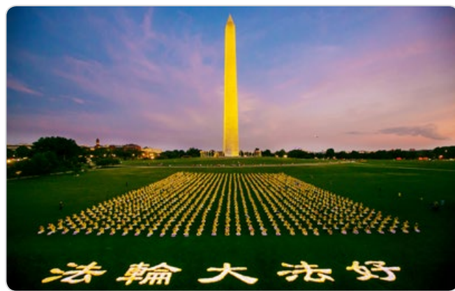
美国华盛顿纪念碑下，法轮功学员烛光集会，纪念20多年的和平反迫害历程。

1999年7月20日，中共对修炼“真、善、忍”的上亿法轮功学员发起残酷迫害。25年来，法轮功学员坚守正信，捍卫人类道德，和平理性地抵制迫害，传播真相，获全球赞誉和声援。欧洲法轮功之友主席约翰·迪伊说：“尽管面临残酷的迫害，中国的修炼者没有被吓倒，中共也没能影响或减少法轮大法对世界的积极影响，这一事实清楚地表明迫害很快就会结束。”迪伊说：“这只是一个时间问题，因为一善胜百恶。”