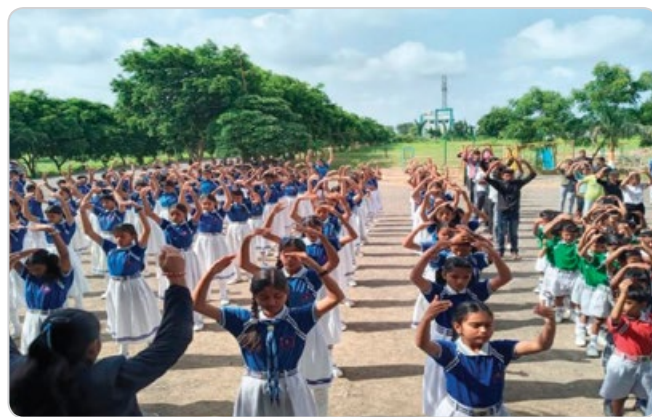
2023 年夏，印度中部 15 所学校的师生学炼法轮功，学生说炼功后思维更清晰。

法轮功弘传 100 多国，许多学校的师生学功后，都感到法轮功有益身心健康。西班牙马德里的一位老师说：“没想到平时很难安静的学生会坚持炼法轮功这么久，这很重要，现在的人过分依赖手机和电脑，变得越来越浮躁。法轮大法能让人变得平和，这正是现代社会需要的。”印度《巴斯卡尔印地文报》刊文说：“印度很多学校在教法轮功。学生学功后，成绩提高，行为明显规范。法轮功不收费，强调人要重视道德。”