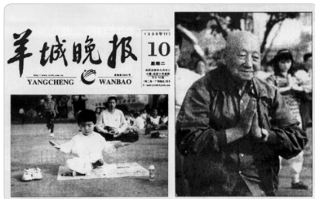
《羊城晚报》1998 年报导“老少皆炼法轮功”，并刊登了一位 93 岁老人炼功的照片。

山东烟台一名九旬老伯在 2024 年 5 月通过明慧网表达对法轮功创始人李洪志师父的感恩，他说：“法轮大法好，真善忍好——这是我天天诚念的口诀。我因患直肠癌做了手术，为了避免化疗的痛苦，每天早饭前我就念这九个字。感谢师父护佑，我没做化疗，现在 6 年过去了，癌细胞全没了！我现在满面红光，熟人都夸我年轻了。我们全家人都相信法轮大法好，都做了‘三退’（退出中共党、团、队）。全家人叩拜大法师父！”