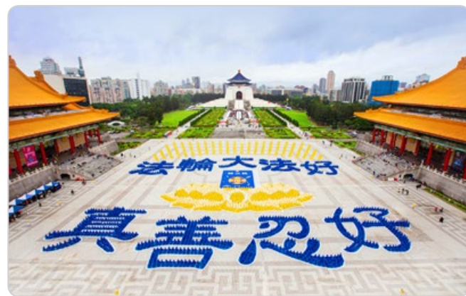
5000多名法轮功学员在台北的自由广场排出“法轮大法好，真善忍好”字形。

每逢新年，明真相、得福报的中国大陆民众都通过明慧网向法轮功创始人李洪志师父拜年并感谢法轮大法的救命之恩。一位来自李大师的家乡——吉林省长春市的市民恭祝师父新年快乐，并赋诗一首表达感恩之心：“病毒来袭太疯狂，世人为此皆惊慌。东躲西藏没办法，谁知我也变成阳。突然想起法轮功，师父能帮我的忙。我虽不是您弟子，念‘法轮大法好，真善忍好’，病毒立刻全灭光。感谢师父的救度之恩！”