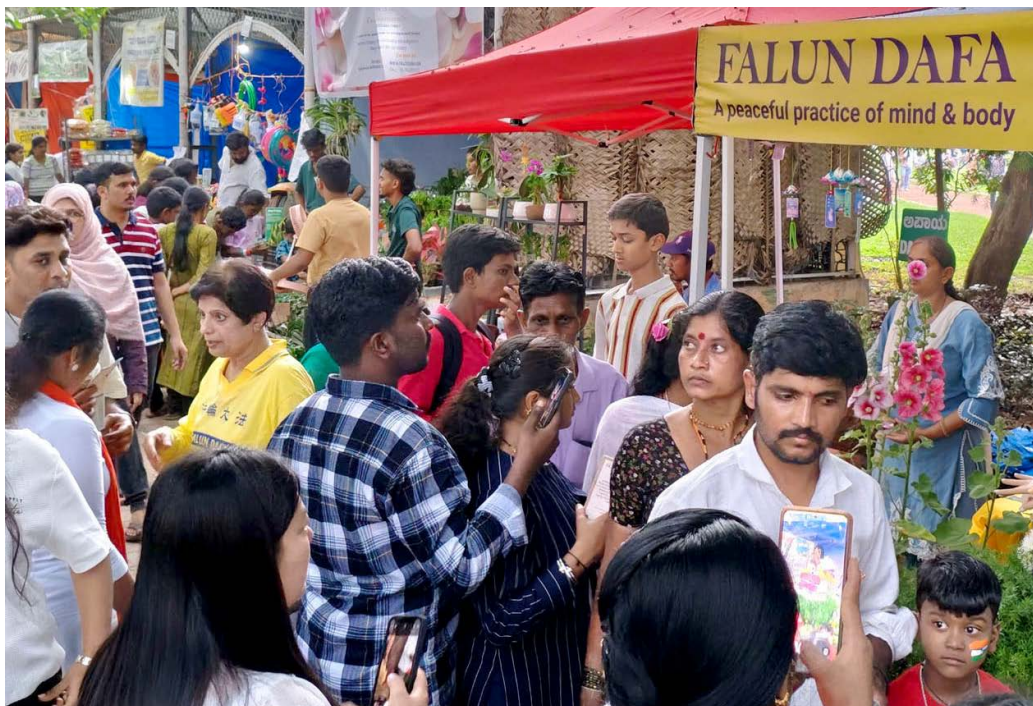
2024年8月8日至19日，法轮功学员受邀参加在班加罗尔植物园举行的拉尔巴格花卉展。