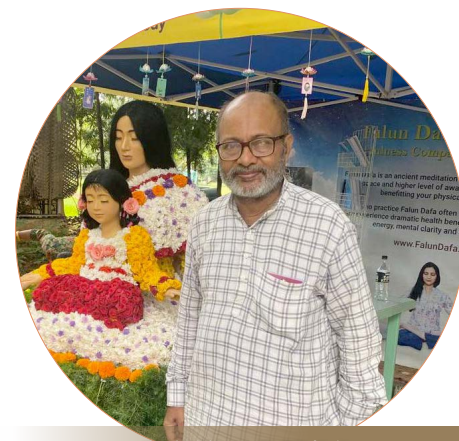
印度前议员阿内尔