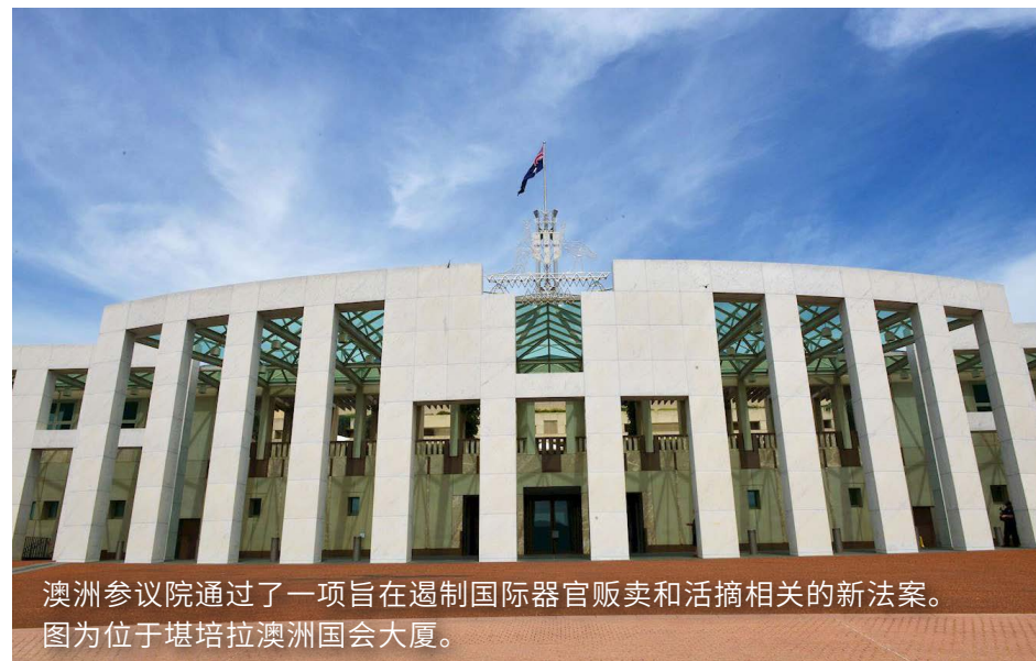
澳洲参议院通过了一项旨在遏制国际器官贩卖和活摘相关的新法案。 图为位于堪培拉澳洲国会大厦。

2001年1月23日下午，中共自导自演了“天安门自焚”伪案。国内几乎所有的电视台、电台、报纸、商场里的电视屏幕都在播放或播报“天安门自焚”伪案。一时间，全国上下都震惊了，街头巷尾到处都在议论着这件事，真似黑浪滚滚，铺天盖地而来。作为一名法轮大法修炼者，我也感到压力重重。我知道《转法轮》书中