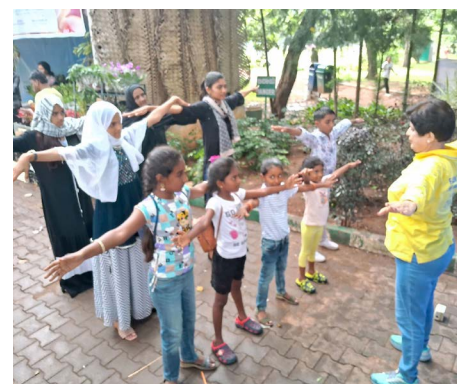
▲ 学员教感兴趣的民众学炼法轮功。