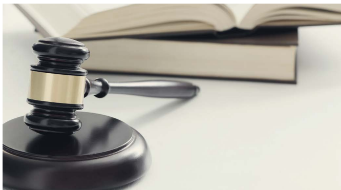
▲ 目前，美国地方法院法官纳塔利·赫特·亚当斯将李平的认罪请求提交给联邦地区法官。