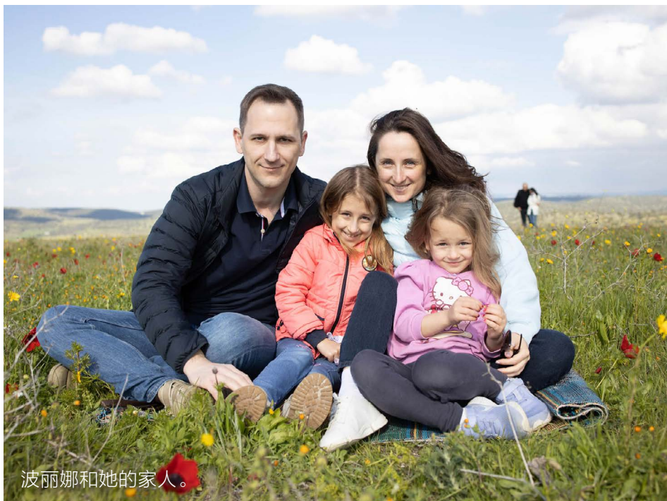
波丽娜和她的家人。