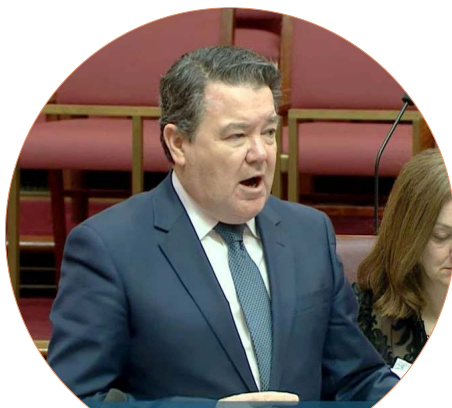
西澳自由党联邦参议员迪恩·史密斯