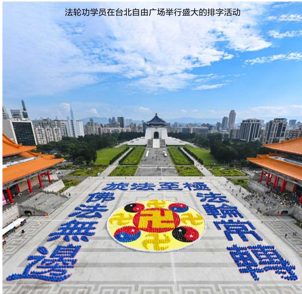
法轮功学员在台北自由广场举行盛大的排字活动