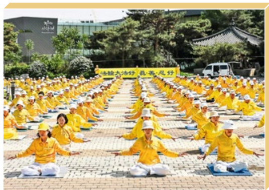
2024年5月12日，韩国法轮功学员在总统府青瓦台前炼功。