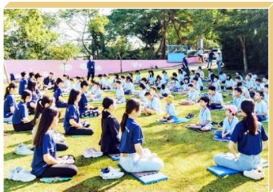
台湾青年法轮功学员 2024 年暑假举办儿童夏令营，教孩子们打坐。