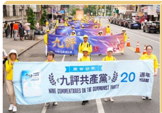
2024年7月,纽约大游行,纪念《九评共产党》发表20年。

该书让人看清了这样的事实:中国不等于中共。爱国不等于爱党。中共一直用谎言与暴力迫害中国人,在历次运动中导致8000万中国人非正常死亡。中共宣扬无神论,让人不信善恶因果,让人跟着它在各种运动中掠财害命,造下深重的罪孽而不自知。“三退”不是搞政治,是让人选择善良,不与恶党为伍。这样,中共的恶行招致的天谴就不会落在自己身上。至2024年8月,已有4.3亿中国人择善而从,声明“三退”。