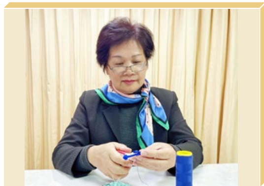
丽美修炼法轮大法20多年，身心有了脱胎换骨的改变。