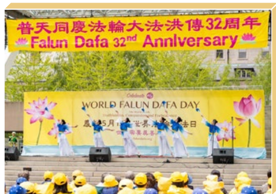
2024年5月11日，加拿大多伦多庆祝法轮大法传世32周年。