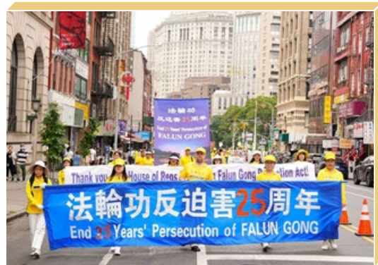
2024年7月20日纽约游行，纪念法轮功学员和平反迫害25周年。

2024年6月25日，美国国会众议院通过《法轮功保护法案》。2024年7月20日，美国国务院发表声明，敦促中共停止镇压。15个国家的130多名议员联署，呼吁停止迫害法轮功。欧洲法轮功之友主席约翰·迪伊说：“在残酷的迫害中，中国的修炼者没有被吓倒，中共也没能减少法轮大法对世界的积极影响。这清楚地表明迫害很快就会结束。因为一善胜百恶。”