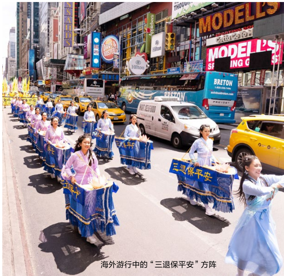
海外游行中的“三退保平安”方阵