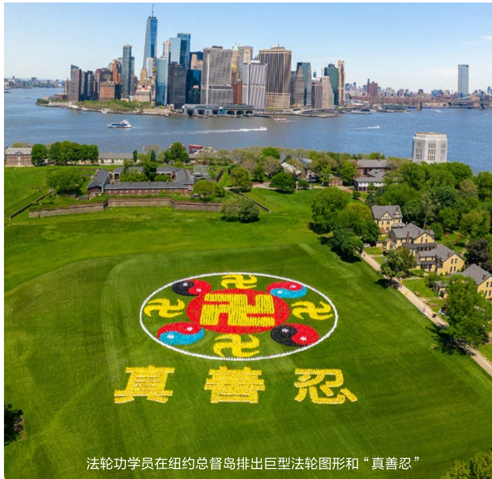
法轮功学员在纽约总督岛排出巨型法轮图形和“真善忍”