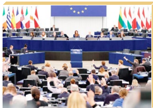
欧洲议会于2024年1月通过决议，要求中共停止迫害法轮功。