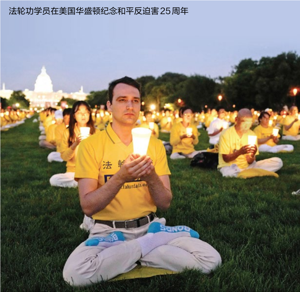
法轮功学员在美国华盛顿纪念和平反迫害25周年