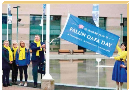
加拿大巴里市市长亚历克斯·纳托尔亲自升起“世界法轮大法日”旗帜。