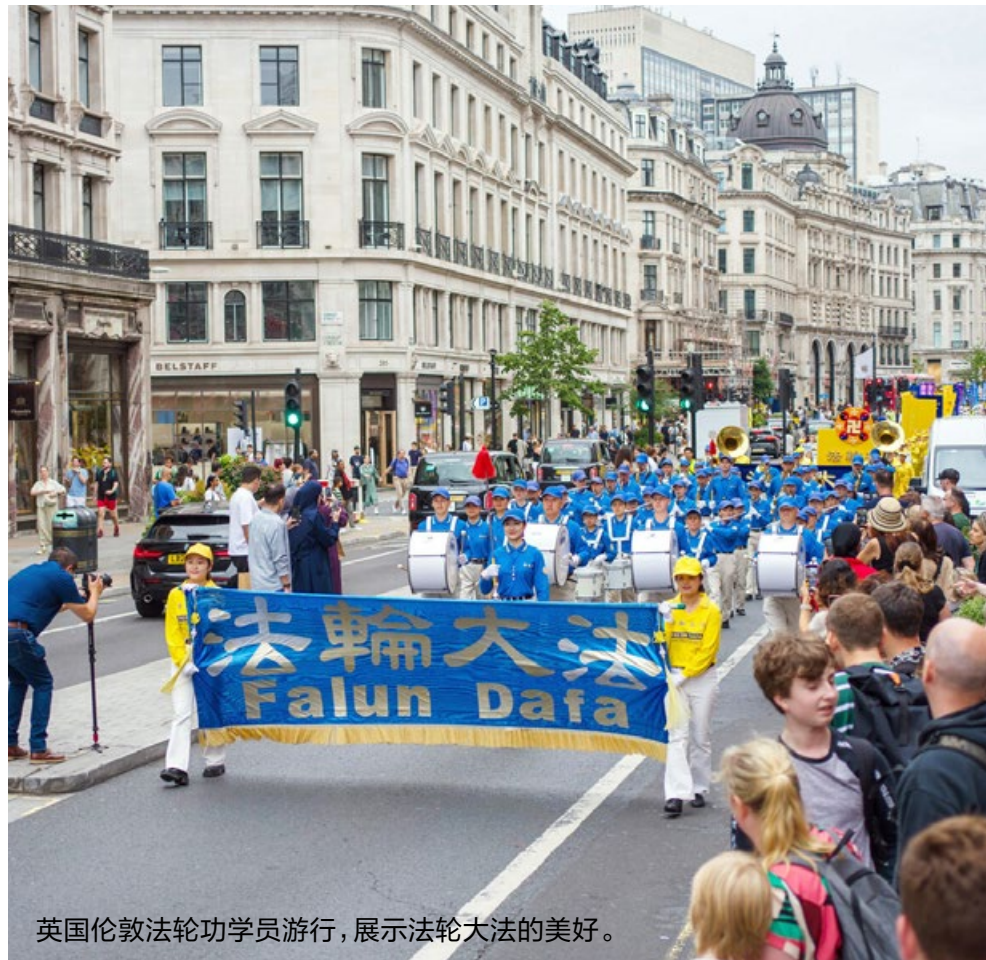
英国伦敦法轮功学员游行，展示法轮大法的美好。