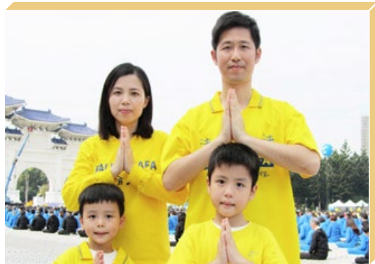
韵如和丈夫忆缘与两个孩子感恩师父传出法轮大法。

韵如说，有时两人都很忙，家务的分担、生活习惯的差异都会造成矛盾。她感到不平时，会想到自己是修炼人，要放下争斗心，包括争一个公平，争一个理解，向内心找到自已的问题，而不是要求对方改变，矛盾往往就消失了，法轮功修炼真的很美妙。她说：“我们每天也会带着孩子打坐和学习《转法轮》。用‘真、善、忍’的法理，以讲故事的方式和孩子沟通，孩子都能理解。两个孩子在充满正能量的家庭氛围中健康成长。”