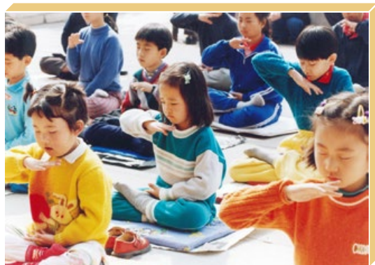
法轮功被中共迫害之前，北京市法轮功小弟子放学后集体炼功。