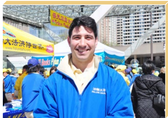
加拿大医生约瑟夫体会到，修炼法轮功能真正获得身心健康。

“我儿子出生时昏迷，在监护室住了一周。痛苦中，我想起师父说过修炼上要讲顺其自然。我调整了心态，不再被担心和恐惧支配。这种理智、平静的心态帮助我走过了这场巨难。现在，我的儿子健康成长……我在法轮功学习班网站做义工，有7万人在网上学了功。看着一封封的感谢信，我意识到法轮功也给他们的生命带来了光明。”