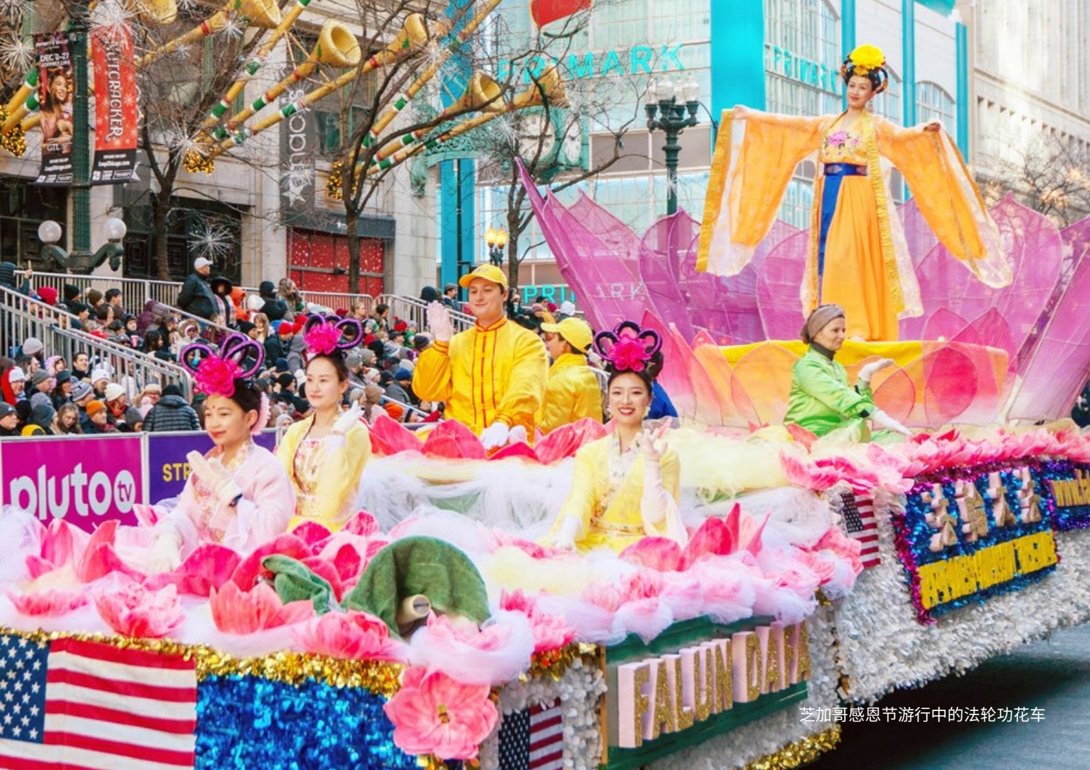
芝加哥感恩节游行中的法轮功花车