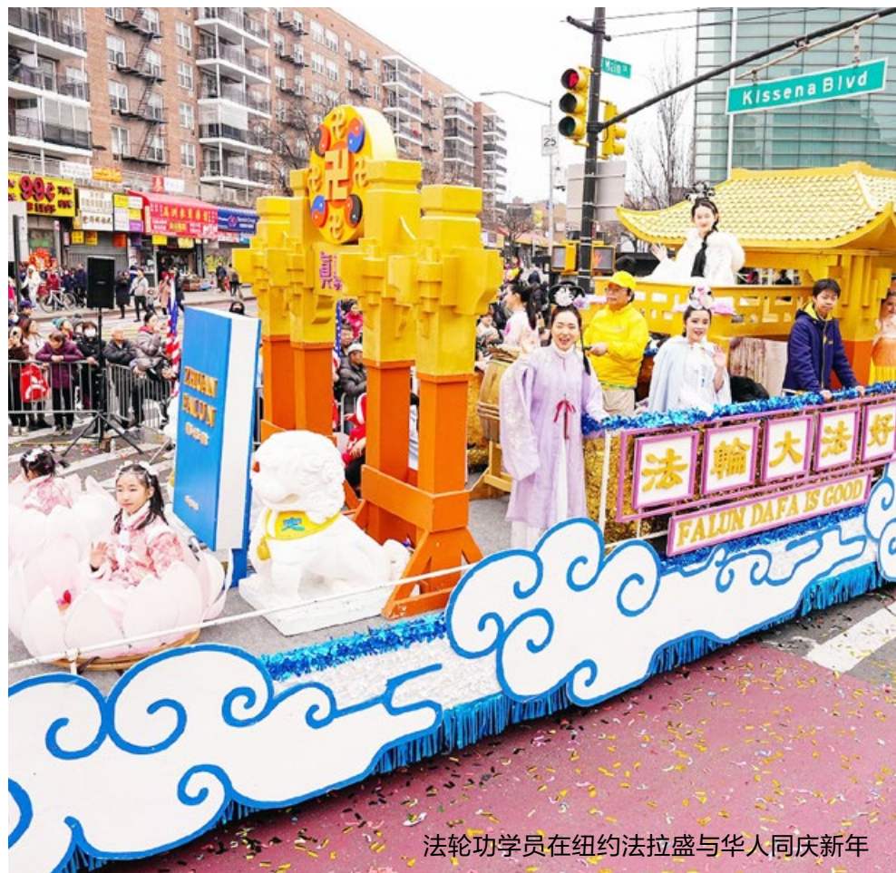
法轮功学员在纽约法拉盛与华人同庆新年