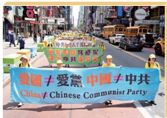
海外游行以横幅展示真相,声援4亿多中国人“三退”。