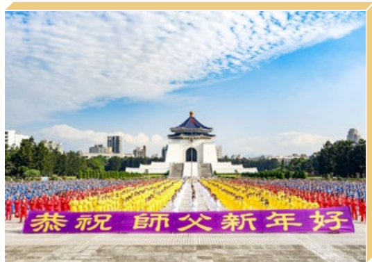
来自台湾、韩国、马来西亚等地的部分法轮功学员在台北遥祝师父新年好。

山东烟台一名九旬老伯说：“法轮大法好，真善忍好——这是我天天诚念的口诀。我因患直肠癌做了手术，为了避免化疗的痛苦，每天早饭前我就念这九个字。感谢师父护佑，我没做化疗，现在6年过去了，癌细胞全没了！熟人都夸我年轻了。我们全家人都相信法轮大法好，都做了‘三退’（退党团队）。全家人叩拜大法师父！”