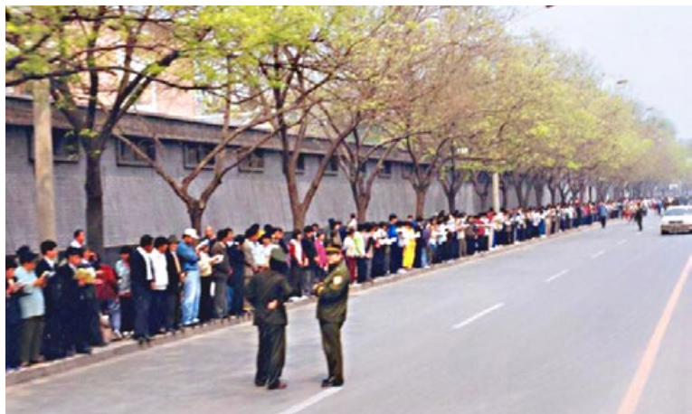
1999年4月25日上访现场秩序井然，两名警察在一旁悠闲站立。