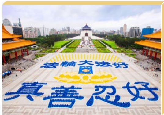
5000多名法轮功学员在台北排出“法轮大法好，真善忍好”字形。