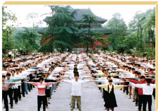
1998年，四川省成都市法轮功学员在南郊公园炼功。