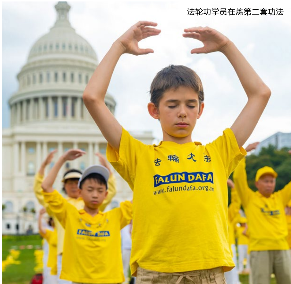
法轮功学员在炼第二套功法