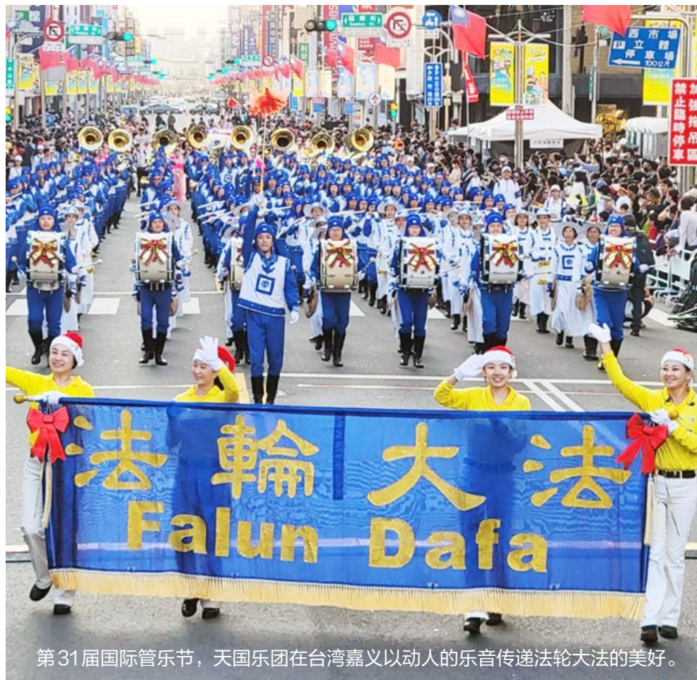
第31届国际管乐节，天国乐团在台湾嘉义以动人的乐音传递法轮大法的美好。