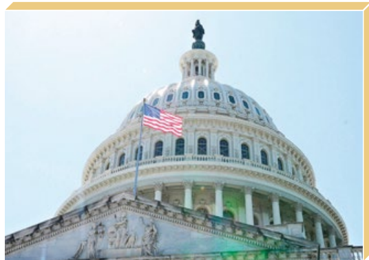
2024年5月13日，美国国会大厦升旗，向李洪志先生致敬。

美国国会大厦当日升起国旗，向李洪志先生致敬。全球数百名政要褒奖法轮功。加拿大各级政要送上104份贺信和褒奖，11个城市特此举行升旗仪式，市长和议员现场宣读褒奖令，盛赞法轮功提升人们的道德，为世界带来福祉。加拿大资深国会议员朱迪·斯格罗说：“法轮功不仅能促进内心的平和，也有助于我们国家的和谐。修炼法轮功的人越多，作为个体就越健全完善，我们的国家也就越强大！”