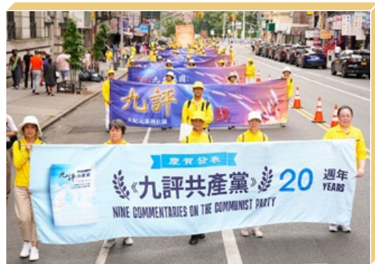
2024年7月,纽约大游行,纪念《九评共产党》发表20年。

该书让人看清了这样的事实:中国不等于中共。爱国不等于爱党。中共一直用谎言与暴力迫害中国人,在历次运动中导致8000万中国人非正常死亡。中共宣扬无神论,让人不信善恶因果,让人跟着它在各种运动中掠财害命,造下深重的罪孽而不自知。“三退”不是搞政治,是让人选择善良,不与恶党为伍。这样,中共的恶行招致的天谴就不会落在自己身上。至2024年8月,已有4.3 亿中国人择善而从,声明“三退”。