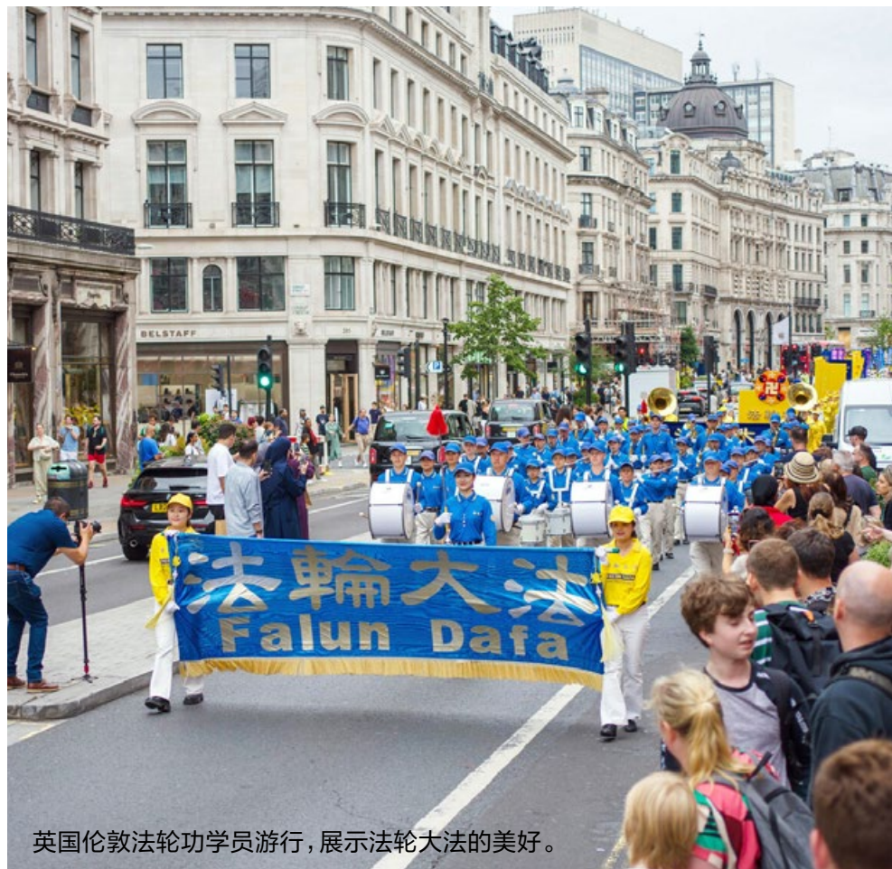
英国伦敦法轮功学员游行，展示法轮大法的美好。