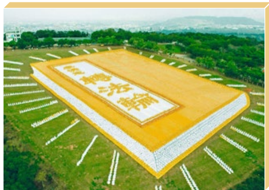
6000多名法轮功学员在台湾台中市排出《转法轮》书籍模型。

当年，她用一个晚上的时间将《转法轮》读完。“读这本书时，觉得全身有很多东西在转。继续看书才知道，原来是法轮啊！早上感到身体轻松。然后我开始吐痰，持续近一个月。师父帮我净化了身体，”她说，“用‘真、善、忍’的法理修炼心性，命运就不一样了。比如我以前没有做到真正的善，所以表面态度再好，也不会让丈夫感动。当我放下了怨恨，真正改变自己，善念善行，家里环境也变好了。能得到师父的救度，真的很幸运！”