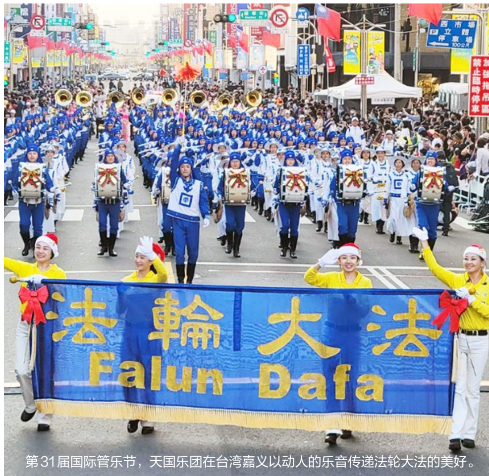
第31届国际管乐节，天国乐团在台湾嘉义以动人的乐音传递法轮大法的美好。