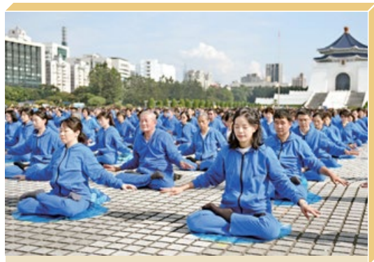
排字活动之后，法轮功学员一起炼第五套功法。