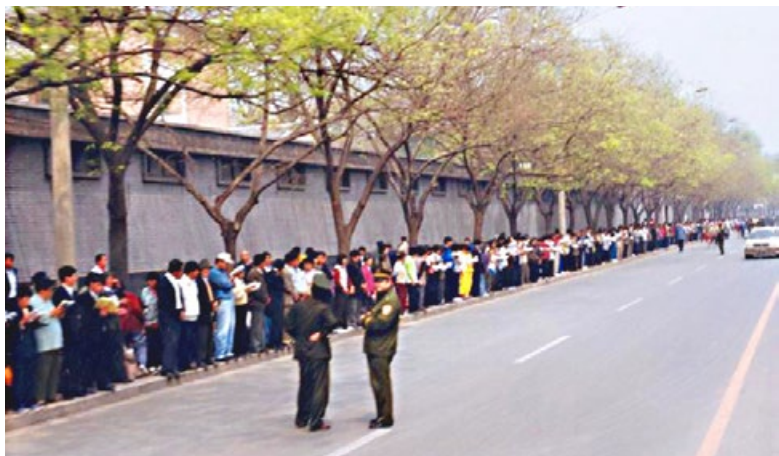
1999年4月25日上访现场秩序井然，两名警察在一旁悠闲站立。