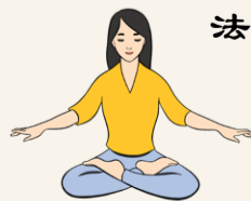
【第五套功法】 神通加持法