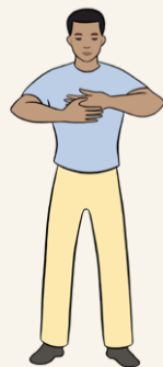
【第四套功法】 法轮周天法