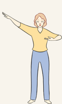
【第一套功法】 佛展千手法

法轮大法又称法轮功，是由李洪志先生于1992年5月传出的佛家上乘修炼大法，以“真、善、忍”为根本指导，包含五套动作舒缓、优美的功法。迄今，法轮大法已弘传世界100多个国家和地区。李洪志先生和法轮大法因对人类身心健康的杰出贡献，获各国政府褒奖、支持议案和信函逾万项。