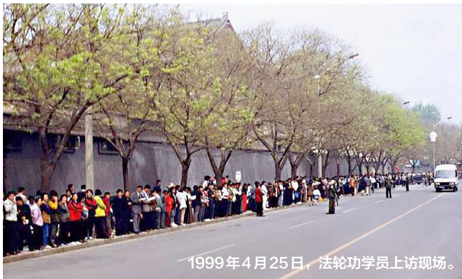
1999年4月25日，法轮功学员上访现场。