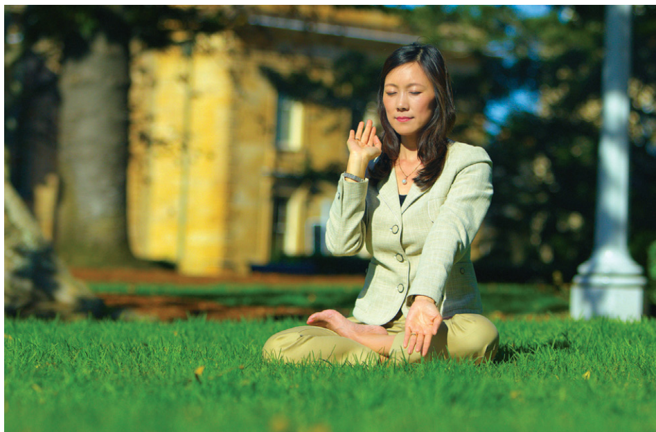
法轮功学员在炼第五套功法

碟，拿回家看，是揭露“天安门自焚”伪案的。我想：一个政党为了打压“真、善、忍”信仰群体，竟然制造谎言，诬陷欺骗，利用整部国家机器实施迫害，这是一个什么政党？我终于明白了，我参与迫害这个群体就是在犯罪！从此，我把自已当成大法师父的一个弟子！那是2002年的春天。