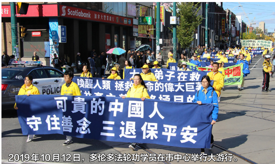
2019年10月12日，多倫多法輪功學員在市中心舉行大遊行。

除了共产党，世界上没有第二个政党要求人在加入时发誓要为它牺牲一切。发了这个毒誓，这个生命从此就归共产党管，成了它的一分子，它让你怎么样就怎么样。天灭中共时，没有解除毒誓的人就会随其陪葬。“三退”（退党、退团、退队）就是解除这个毒誓，与中共划清界线，在天灭中共时保命，保平安。