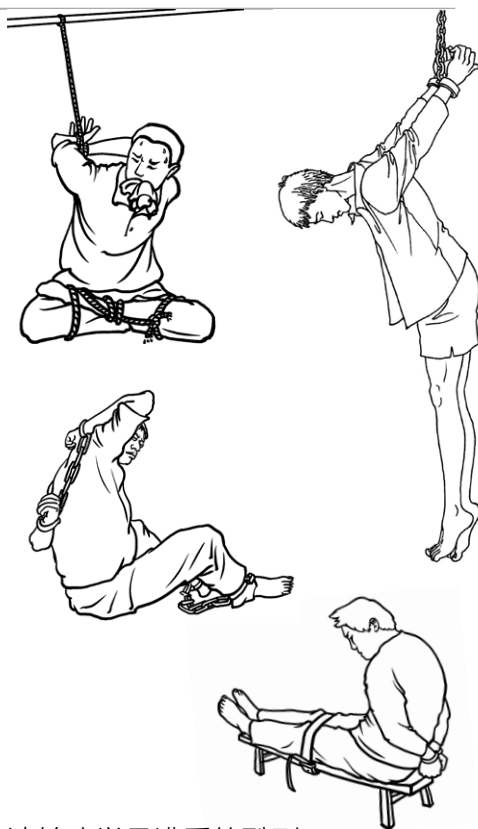
法轮功学员遭受的酷刑

所长、队长等被派到外地劳教所学习“转化经验”，回来后开始实施暴力洗脑。对坚定者动用束缚椅（也称老虎凳）、大背铐，有的被铐在冰冷的暖