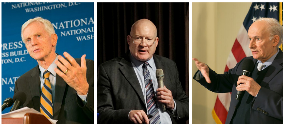
从左至右：大卫·麦塔斯、伊森·葛特曼、大卫·乔高

6日公开了调查报告，结论是“大规模的、违背意愿的、对法轮功修炼者的器官掠夺一直存在且在继续着。”并称之为“这个星球上前所未有的邪恶”。报告被译成18种语言，第3版累计52种证据方法佐证，成书《血腥的活摘器官》。