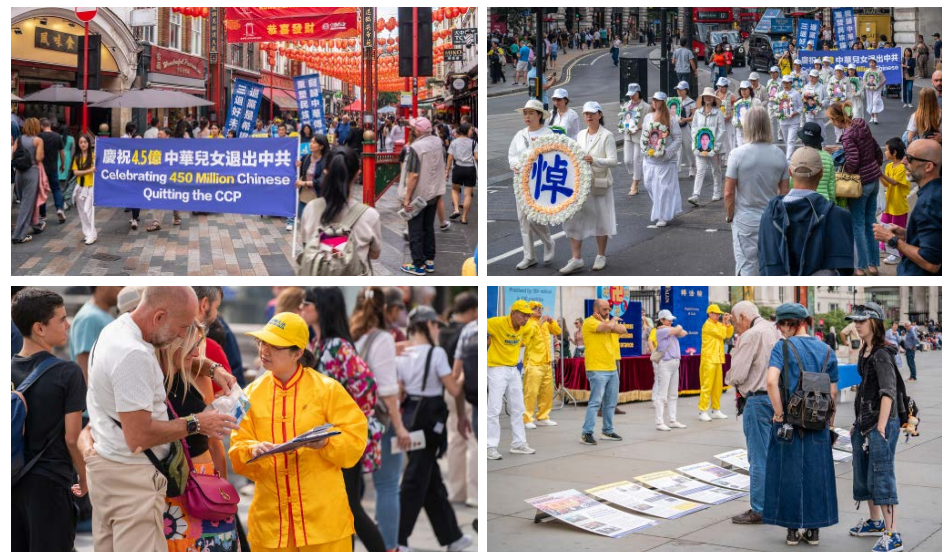
▲ 英国各地的法轮功学员齐聚伦敦市中心举行盛大游行和集会。图片包含法轮功学员游行队伍来到特拉法加广场，举行功法演示和讲真相活动

因此被迫害甚至被杀害。尤其是当他们的修炼根本没有对他人造成任何伤害的时候，更不应该如此。”