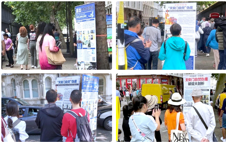
▲ 中国游客及大陆留学生在伦敦大英博物馆前阅读真相展板和拍照收藏