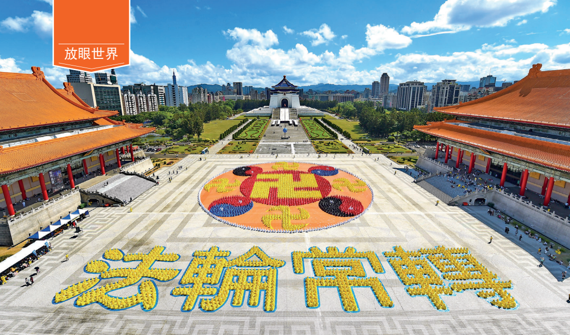
■ 二零二五年十月十八日，约五千名法轮功学员在台北自由广场排字，排出历年来最大的法轮图形和“法轮常转”四字。