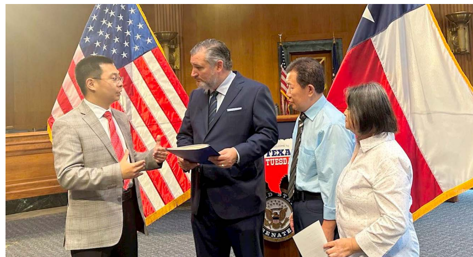
法轮功学员宇昊和父母向泰德·克鲁兹参议员（左二）递交十封来自德州议员的支持和感谢信，感谢克鲁兹参议员在国会参议院提出《法轮功保护法》