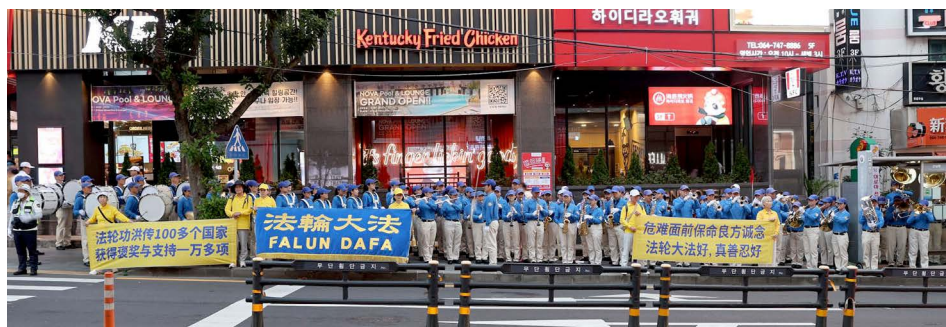
▲ 法轮功学员在济州港码头以及游客必到的免税店前演奏并向中国游客展示真相横幅