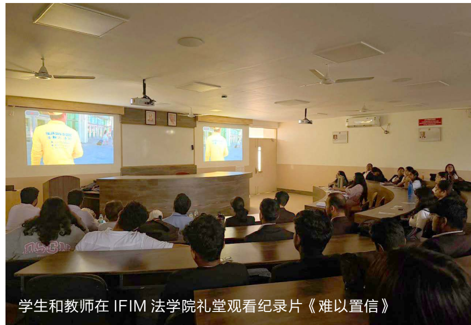
学生和教师在 IFIM 法学院礼堂观看纪录片《难以置信》

中国的历史远超中共：中国拥有五千年的文明史，涵盖多个朝代、文化和传统，而中共成立于1921年，仅有百余年历史，1949年才开始执政。中国的文化、语言、哲学（如儒家、道家）和价值观早在中共之前就已形成，且在中共执