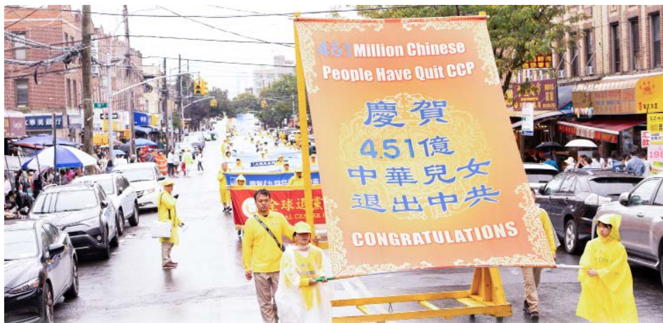
今年 9 月 7 日纽约部分法轮功学员上千人在布鲁克林八大道举行盛大游行