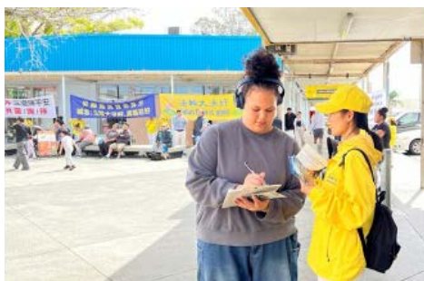
▲ 奥塔瓦市场（Otago market）的人们纷纷来了解真相

无辜群体，包括修炼打坐的法轮功学员，“这是一种严重违反人性的行为。”他认为，数亿中国人退出中共组织“是正确的一步，对中国的未来有益”。