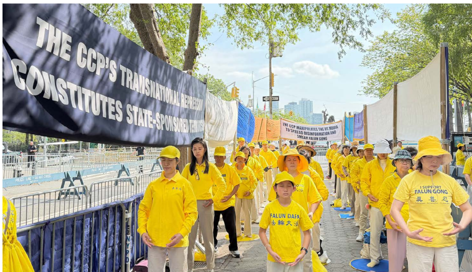
第 80 届联合国大会 9 月 23 日召开，法轮功学员在纽约联合国总部外炼功及和平请愿，呼吁各国联手制止中共的迫害