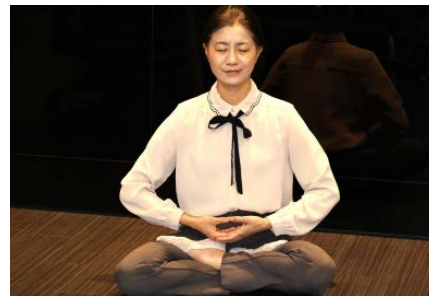
▲ 秀璟在炼法轮功的第五套功法