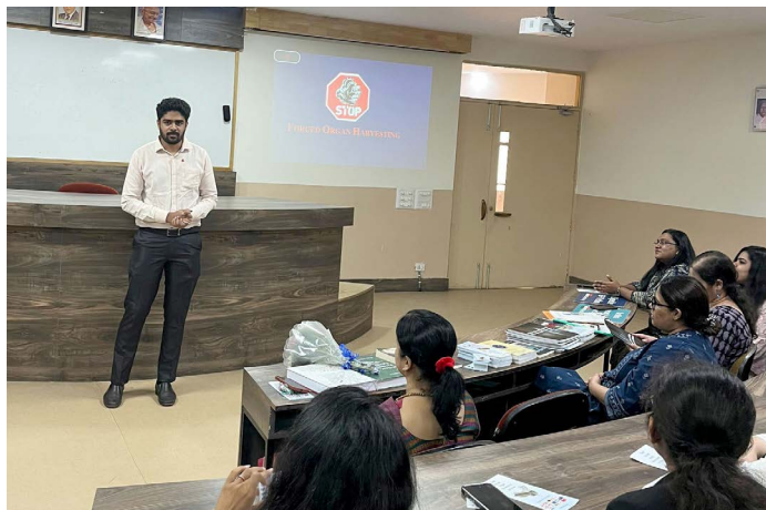
▲ 维平博士在电影放映会结束后主持问答环节

活摘被囚信仰者的器官后，观众们震惊不已，深表关切，认为这场罪行无异于反人类的种族灭绝。几乎所有观众都在请愿书上签名，呼吁G7+7国家采取行动，制止中共发动的活摘罪行。