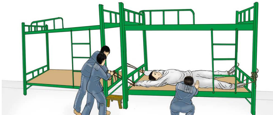
示意图：项利杰遭受的桡刑