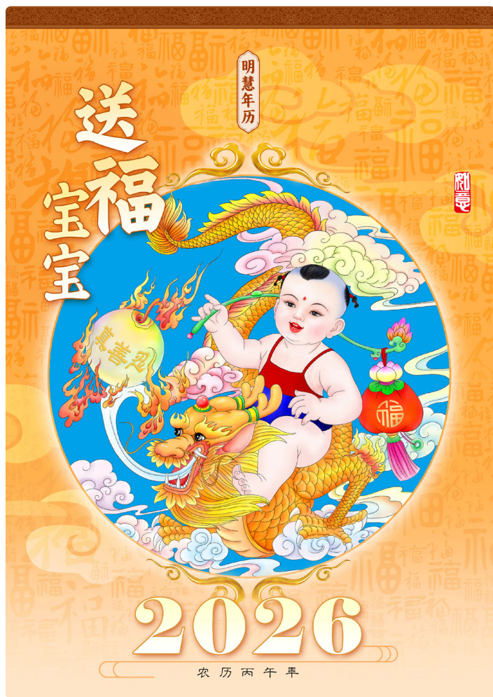
▲ 明慧2026年《送福宝宝》挂历

不理解的地方问女儿,女儿说:“就像你上学,遇到不会的题先放下,继续往下学,慢慢就会了。《转法轮》讲的是宇宙大法,越学理解得越多。”我觉得女儿说得有道理,就决定修炼大法了!