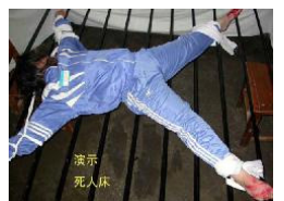
▲中共酷刑图：野蛮灌食、塑料袋套头、电棍电击、抻床（死人床）