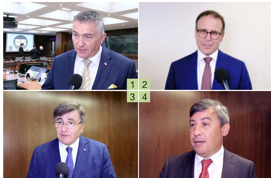
图 1 至图 4：加拿大影子国防部长詹姆斯·贝赞，参议院反对党领袖、参议员侯塞克斯，联邦保守党国会议员马国基，保守党国会议员庄文浩

多位职员表示，炼功后注意力更加集中，身心放松、精力充沛。一名职员分享到：“法轮大法的功法让人很平静，炼完之后整个人轻松了许多。”