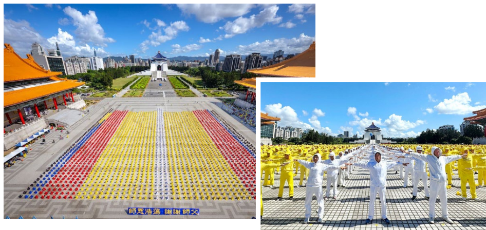
▲ 左图为法轮功学员以“师恩浩荡 谢谢师父”横幅向李洪志师父表达敬意；右图为 5,000 名法轮功学员于排字结束后，举行集体炼功