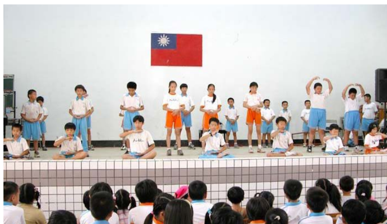
▲ 学生在学校展示法轮功五套功法

2003年，她负责学校辅导行政，利用午休开办团体辅导班，让孩子学炼法轮功，家长们也非常支持。《转