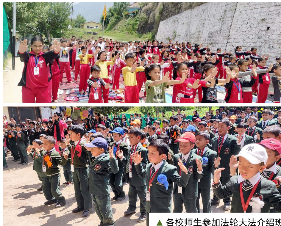
▲ 各校师生参加法轮大法介绍班

2024年，法轮功学员向全球45个国家递交制裁名单，呼吁冻结名单中涉事人员的资产并禁止入境。贝赞议员希望将C-219法案命名为“全球马格尼茨基制裁法”，“以确保那些通过非法手段获利的（外国）人，以及迫害法轮功修炼者、维吾尔人、基督徒和其他中国境内少数民族与宗教群体的（外国）人，都能被追究责任。该原则同样适用于针对其他国家，包括伊朗、朝鲜与俄罗斯。”