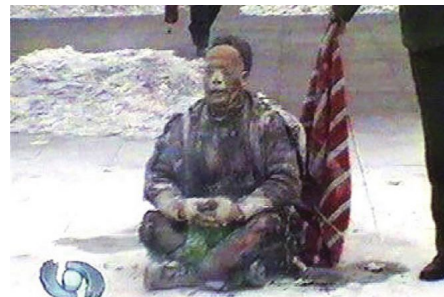
▲ 2001年1月23日，大年除夕，中共炮制了一场以污蔑法轮功为目的“天安门自焚”伪案

许多人因此看清了中共的邪恶，选择退出中共“党团队”；也有人仍被谎言蒙蔽，不愿面对现实。