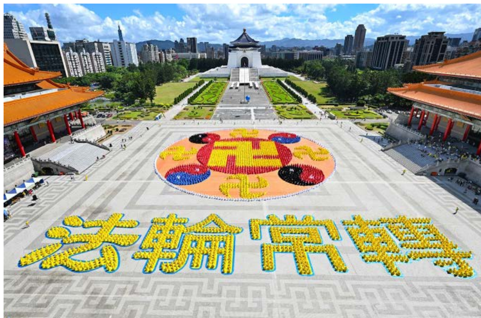
2025年10月18日，约5,000名法轮功学员在台北自由广场排字，排出历年来最大的法轮图形和“法轮常转”四字

它要迫害谁，就先污蔑谁：要整知识分子，就先骂他们是“臭老九”；要掠夺地主、资本家的财富，就污蔑他们是“剥削阶级”；官场内斗中要整倒对手，就先给他们扣上“叛徒”、“内奸”的帽子；要毁灭传统文化，就