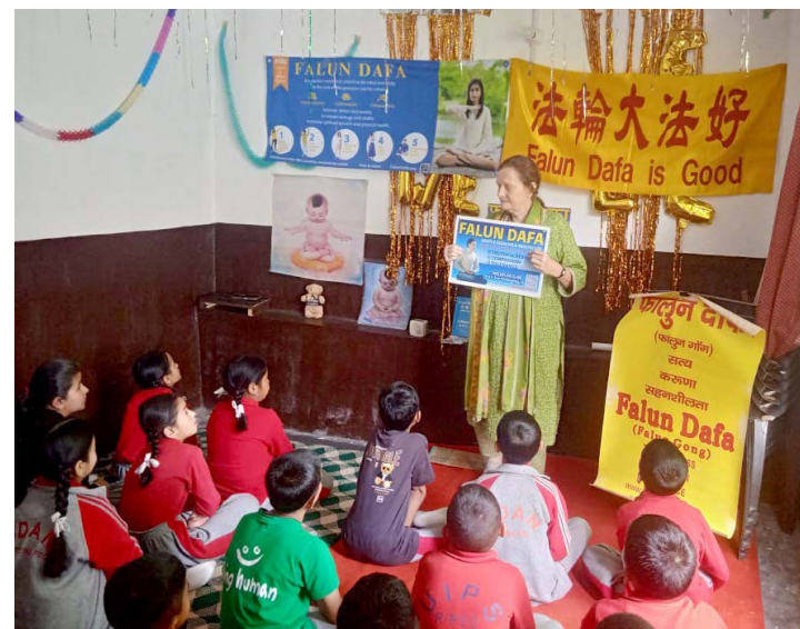
▲ 法轮功学员向师生介绍法轮功并免费教授功法

老师们表示，法轮大法所倡导的价值观能够帮助学生提升专注力、树立正确的道德观。炼功后，不少学生分享说自己感到身心放松、内心平静、精神愉悦。