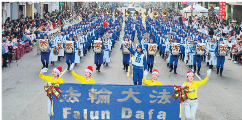
台湾法轮大法天国乐团受邀参加今年的台湾嘉义市“国际管乐节”嘉年华。

【明慧网】节日游行是世界各地人们喜闻乐见的庆祝活动。二十年来，一个身穿蓝白相间、古典唐朝乐官服饰的军乐团广受观众喜爱，他们是2005年底在纽约率先成立的天国乐团。由法轮功学员组成的天国乐团目前已遍及美国、加拿大、澳大利亚、台湾、欧洲等二十多个国家，为人们送去节日祝福与真善忍的美好。