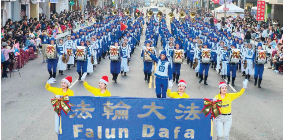
台湾法轮大法天国乐团受邀参加今年的台湾嘉义市“国际管乐节”嘉年华。

【明慧网】节日游行是世界各地人们喜闻乐见的庆祝活动。二十年来，一个身穿蓝白相间、古典唐朝乐官服饰的军乐团广受观众喜爱，他们是2005年底在纽约率先成立的天国乐团。由法轮功学员组成的天国乐团目前已遍及美国、加拿大、澳大利亚、台湾、欧洲等二十多个国家，为人们送去节日祝福与真善忍的美好。