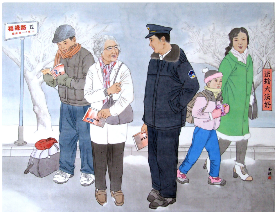
▲ 明慧网绘画作品《有缘》