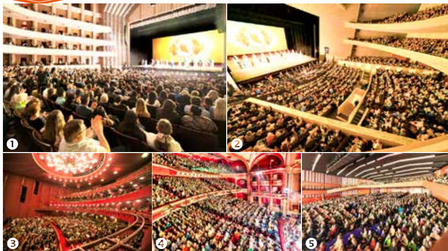
■ 神韵八个艺术团正在全球各地巡回演出。① 美国拉斯维加斯 ② 法国南特 ③ 美国首都华盛顿 ④ 英国布里斯托 ⑤ 荷兰阿姆斯特丹