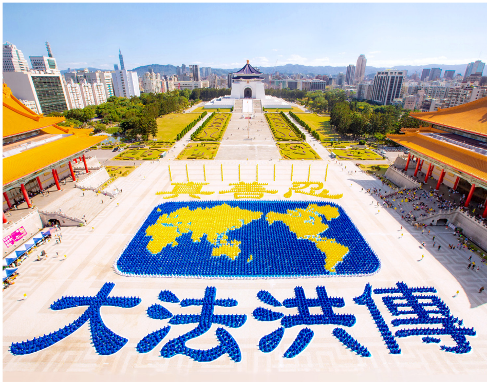
▲ 2019年11月16日，约6500名法轮功学员在台湾台北自由广场举行大型排字及集体炼功活动，和世界各地的人们分享法轮大法的美好。