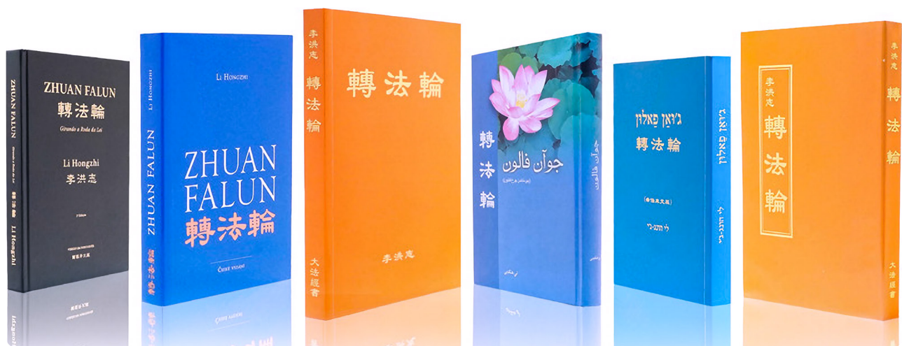
◀ 部分语种的《转法轮》