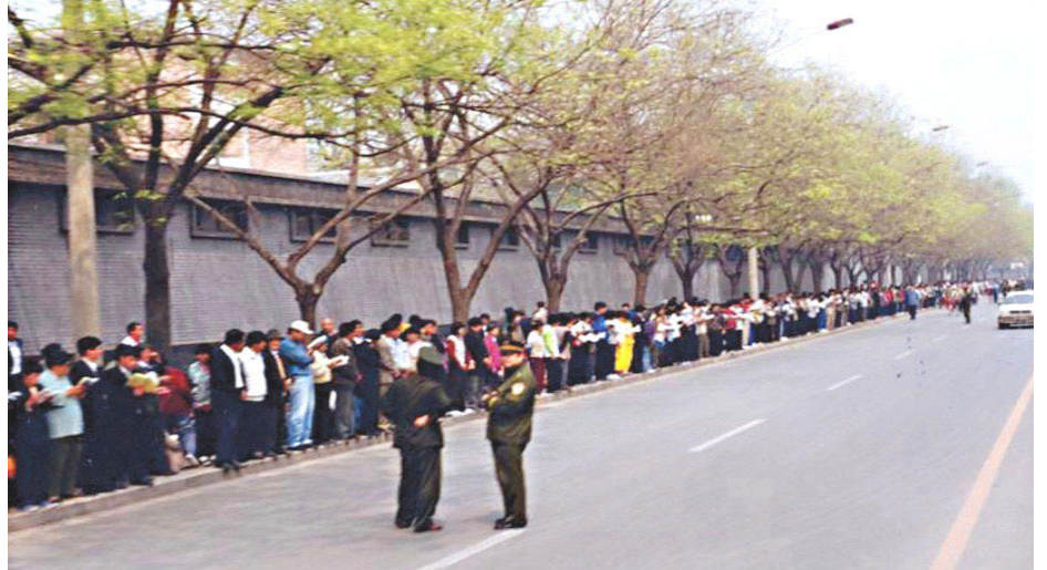
▲1999年4月25日，万名法轮功学员和平请愿现场，执勤警察在闲聊。

基当天和上访的民众临时推选出的代表会谈，并做出了妥善处理，法轮功学员当晚和平散去。整个过程从清晨到夜晚，历时十多个小时，无暴力、无口号、无扰民、无垃圾，善意平静，创造了在中共几十年极权统治下不曾有过的官民成功对话、圆满解决问题的独有范例。