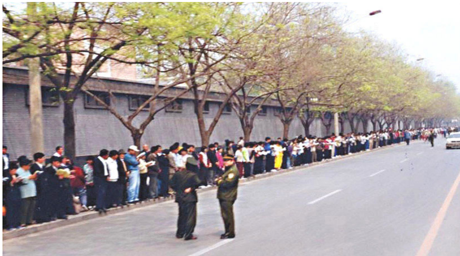
▲1999年4月25日，万名法轮功学员和平请愿现场，执勤警察在闲聊。

基当天和上访的民众临时推选出的代表会谈，并做出了妥善处理，法轮功学员当晚和平散去。整个过程从清晨到夜晚，历时十多个小时，无暴力、无口号、无扰民、无垃圾，善意平静，创造了在中共几十年极权统治下不曾有过的官民成功对话、圆满解决问题的独有范例。