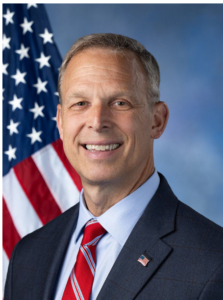
▲ 宾西法尼亚州联邦众议员佩里

2025年2月24日，佩里众议员在国会众议院再次提出《法轮功保护法案》。佩里说：“美国作为世界自由的灯塔，当中共对法轮功学员施行系统性的酷刑、监禁并活摘器官时，美国不能保持沉默。中共及其帮凶必须对