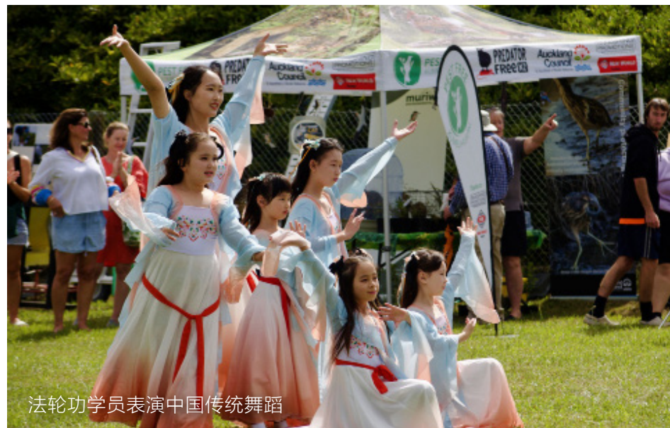
法轮功学员表演中国传统舞蹈