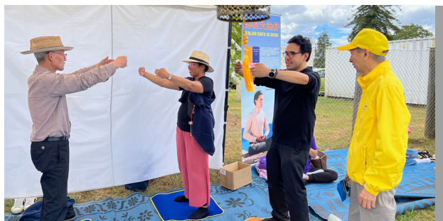
▲ 人们当场学炼法轮功

他最后说道：“虽然我没有深入学习过法轮功，但‘真、善、忍’是人类的道德标准，如果人不真诚、不善良、没有宽容之心，那肯定称不上是一个好人。”