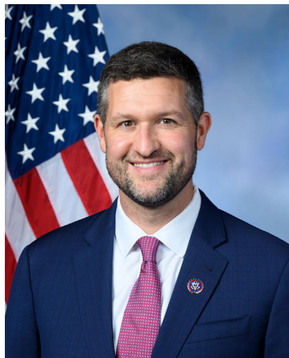
▲ 纽约州民主党联邦众议员派特

议员派特·瑞安表示：“我们必须竭尽全力，让中共的邪恶势力和器官贩卖者为他们令人发指的罪行负责。我很荣幸能共同引领这项跨党派立法，这是朝着这个目标迈出的一大步。我将继续坚定不移地反对限制人权和迫害宗教团体的行为，无论发生在何处。”