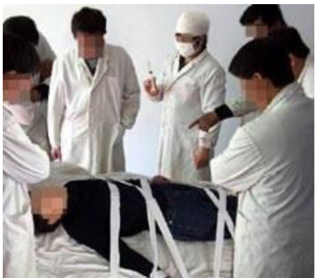
▲ 酷刑演示：打毒针（注射不明药物）