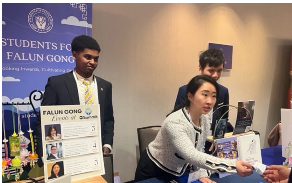
法轮大法学员在展位上向与会者介绍法轮功及其所面临的迫害