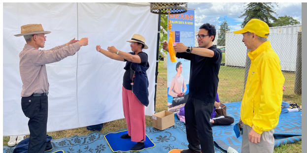
▲ 人们当场学炼法轮功

他最后说道：“虽然我没有深入学习过法轮功，但‘真、善、忍’是人类的道德标准，如果人不真诚、不善良、没有宽容之心，那肯定称不上是一个好人。”