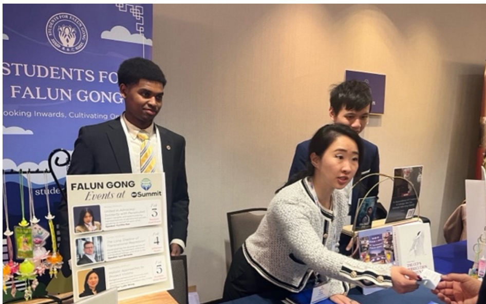
法轮大法学员在展位上向与会者介绍法轮功及其所面临的迫害