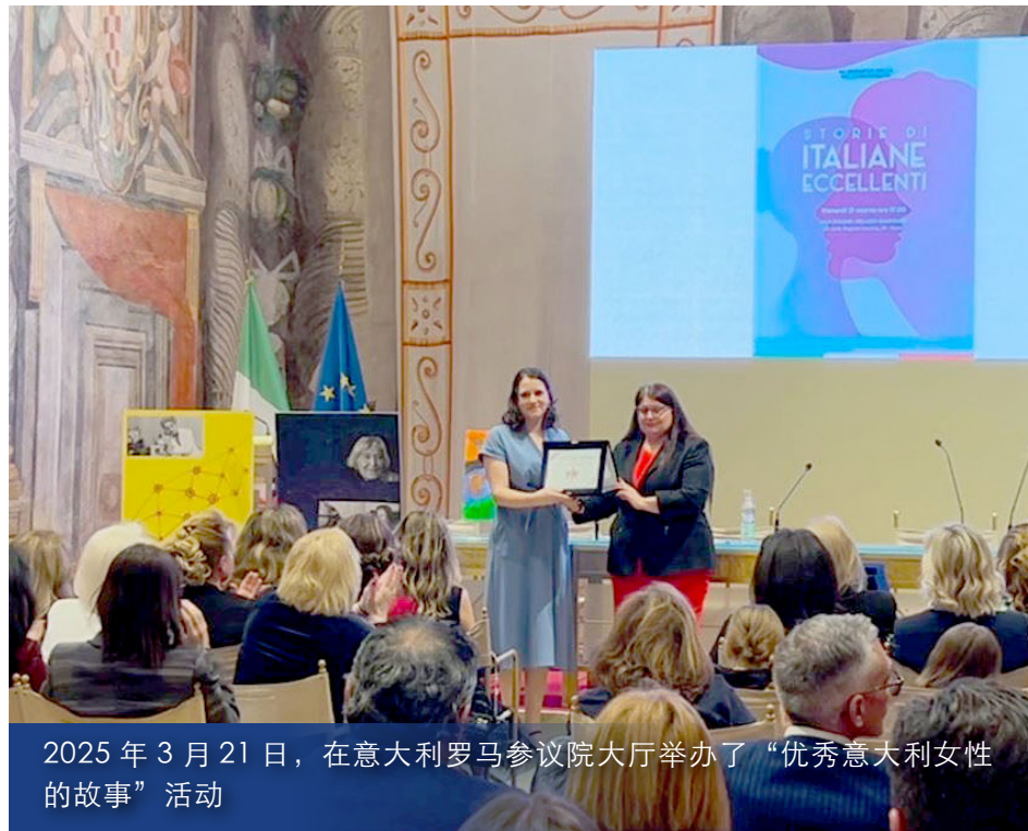
2025年3月21日，在意大利罗马参议院大厅举办了“优秀意大利女性的故事”活动