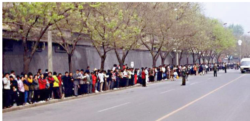
▲法轮功学员的上访极其和平理性，既没有大声喧哗，更没有阻塞交通

1998年12月，上海电视台新闻报道：“今天一大早，上海体育中心人头攒动，本市近万名爱好法轮大法的炼功者会聚一处进行推广表演。法轮大法创始人李洪志师父于1992年向社会公开传功讲法，受到广大群众的欢迎。6年来，功法以炼功时不受场地时间的限制，以及无需意念引导等不同于其它气功的全新内容令人耳目一新，独树一帜。到目前为止，包括港、澳、台在内的全国各