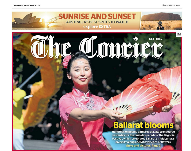
▲ 2025年3月11日，巴拉瑞特主要报纸《信使报》（The Courier）在头版刊登的游行图片展示了法轮功学员的扇子舞表演（网站截图）

法轮功团体的表演时，赞赏表演之余，更表示感受到一种“平和的能量”。当地最大报《信使报》在头版和第二版刊登了游行图片报道，其中头版大图正是法轮功学员的扇子舞表演。