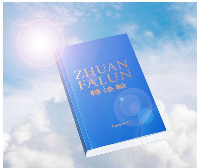
▲法轮大法著作《转法轮》