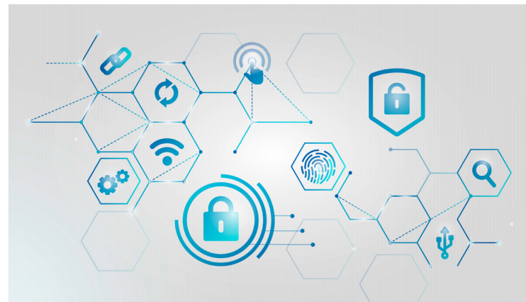
▲ 人脸识别、大数据、血型库与实时监控，使得特定血型、无背景的人群可以被精准锁定（示意图）

正如《荀子·天论》所言：“天行有常，不为尧存，不为桀亡。”真善忍，是天道，不因人信或不信而存在或消亡。顺天者存，逆天者亡——这是每一个中国人终将面对的抉择。■