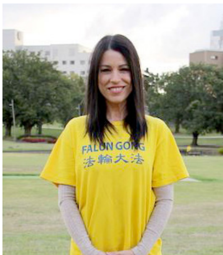
▲ 蒂娜走入大法修炼后身心巨变