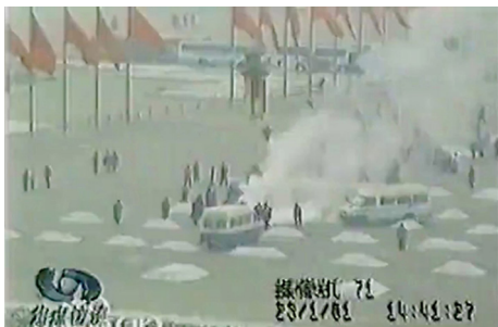
图2：央视报道天安门“自焚”事件的视频截图

够的远景画面后，摄影机镜头慢慢拉近。从这个稳定程度，不难看出，摄影机是放在三脚架上拍摄的。而在面对这类突发性事件时，摄影师一定会手持摄影机，因为当摄影师拿出三脚架，打开之后，再把摄影机放上去的过程，也许就已经错过了很多关键时刻；同时，手持拍摄可以保持摄影机的灵活机动。