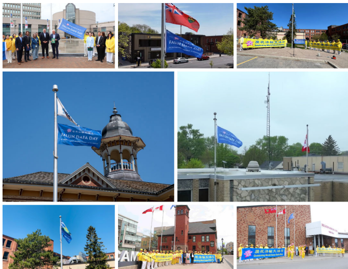
左图：截止到5月13日，加拿大安省共有八座城市通过升旗仪式庆祝世界法轮大法日。