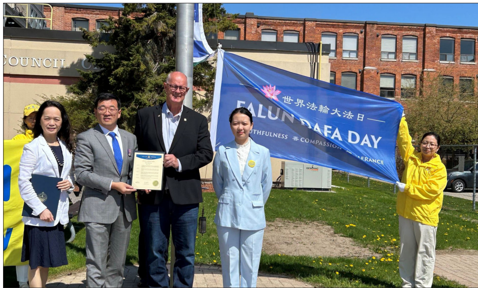
图：奥里利亚市市长唐·麦克艾萨克与法轮功学员一起庆祝世界法轮大法日

这个曾经让我头痛的孩子，现在让我感到骄傲。我们母子走过了一段不容易的路，但我们变得更好了。🙏