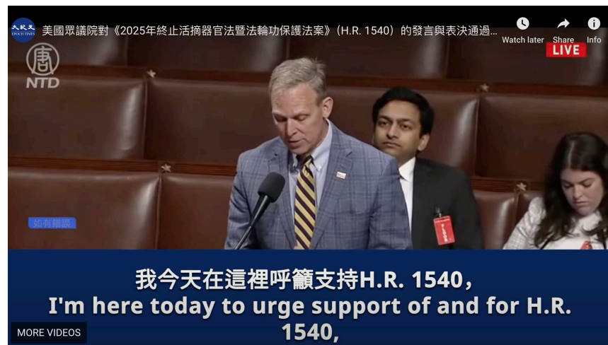
2025年5月5日下午，美国国会众议院一致通过《法轮功保护法案》(Falun Gong Protection Act)。图为：法案发起人宾夕法尼亚州共和党联邦众议员斯科特·佩里（Scott Perry）在国会大厦投票前发言。

同学们，如果你也曾在电视上，或者教科书里，或者老师的口中，了解到所谓的“天安门自焚”事件，希望你已经用自己的智慧找到了真相。无论身体是否在中共的控制之下，当剔除了中共塞给我们的谎言宣传，我们的心就是真正自由的。🧘