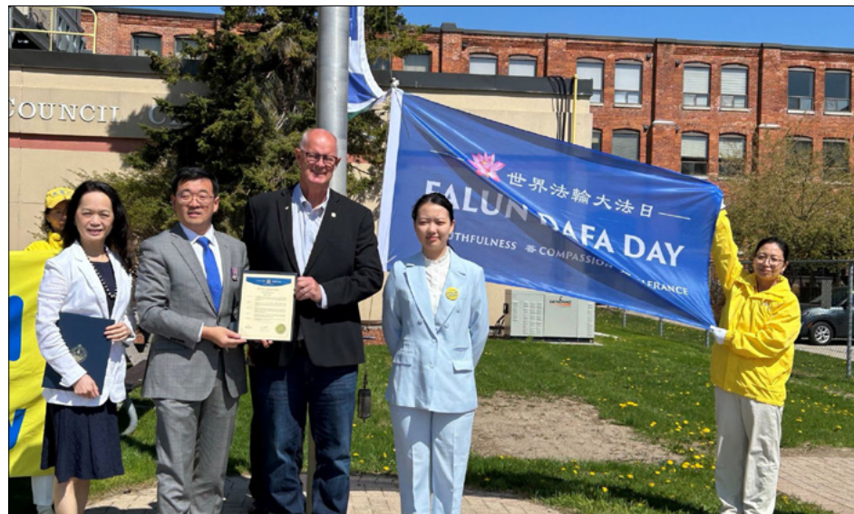
图：奥里利亚市市长唐·麦克艾萨克与法轮功学员一起庆祝世界法轮大法日

这个曾经让我头痛的孩子，现在让我感到骄傲。我们母子走过了一段不容易的路，但我们变得更好了。🙏