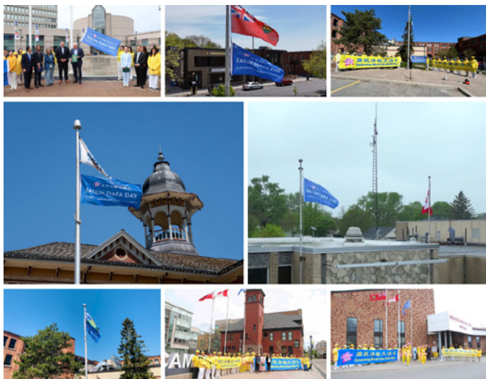
左图：截止到5月13日，加拿大安省共有八座城市通过升旗仪式庆祝世界法轮大法日。