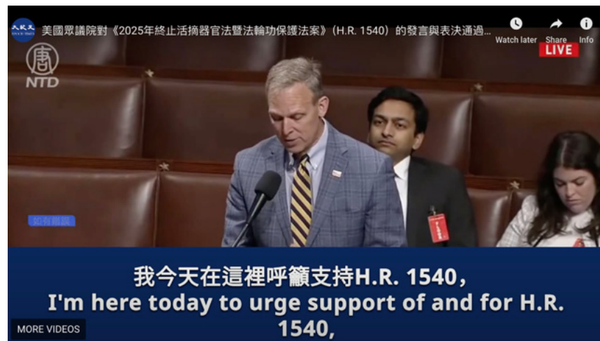
2025年5月5日下午，美国国会众议院一致通过《法轮功保护法案》(Falun Gong Protection Act)。图为：法案发起人宾夕法尼亚州共和党联邦众议员斯科特·佩里 (Scott Perry) 在国会大厦投票前发言。