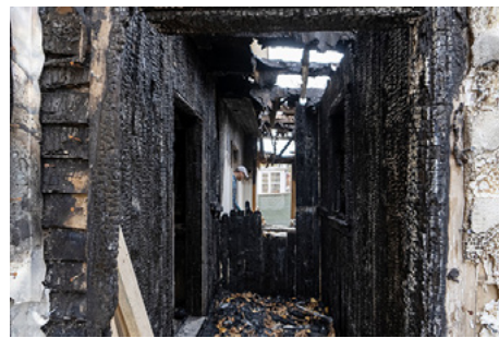
图1：作者拍摄的一部纪录片的场景，几栋房屋遭受火灾后满目疮痍的焦黑废墟。

那是2001年的除夕，央视新闻突然间铺天盖地报导有五人在天安门广场“自焚”的新闻，并且声称是法轮功学员