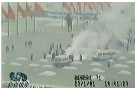
图2：央视报道天安门“自焚”事件的视频截图

够的远景画面后，摄影机镜头慢慢拉近。从这个稳定程度，不难看出，摄影机是放在三脚架上拍摄的。而在面对这类突发性事件时，摄影师一定会手持摄影机，因为当摄影师拿出三脚架，打开之后，再把摄影机放上去的过程，也许就已经错过了很多关键时刻；同时，手持拍摄可以保持摄影机的灵活机动。