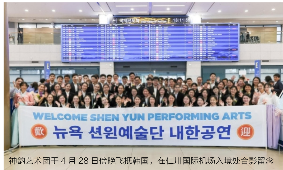
神韵艺术团于4月28日傍晚飞抵韩国，在仁川国际机场入境处合影留念

黑森州议会基民盟议员海科·卡塞克特发来贺信，他在贺信中称赞，在这个特殊的日子，人们将法轮大