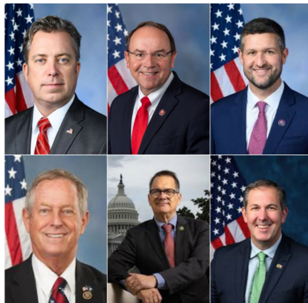
▲ 美国国会众议院两党议员支持《法轮功保护法》

2025年5月5日下午，美国国会众议院全票通过《2025年终止活摘器官法暨法轮功保护法》。多位国会议员表示，这项法案具有里程碑意义，是美国国会首次做出具有法律效力的承诺，将对迫害法轮功学员及参与活摘法轮功学员器官的人员采取具体制裁措施。法案明确要求，中共对法轮功的迫害必须立即停止。这也是美国首次通过立法形式，明确要求追究中共强摘法轮功学