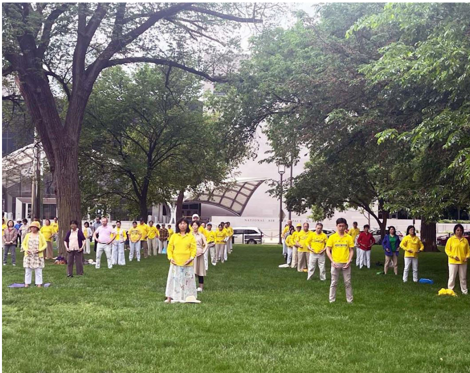
▲ 美国首都华盛顿地区的部分法轮功学员在国家广场大草坪集体炼功，庆祝世界法轮大法日