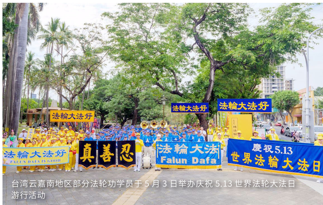
台湾云嘉南地区部分法轮功学员于5月3日举办庆祝5.13世界法轮大法日游行活动