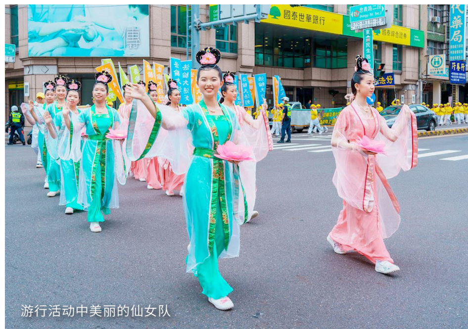
游行活动中美丽的仙女队