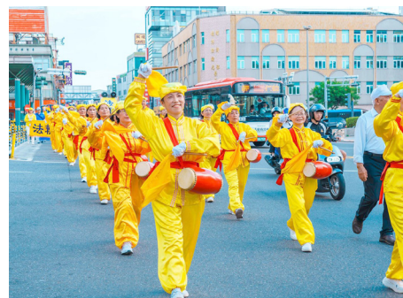
▲ 台湾云嘉南地区“庆祝5.13世界法轮大法日”游行活动中活泼的腰鼓队