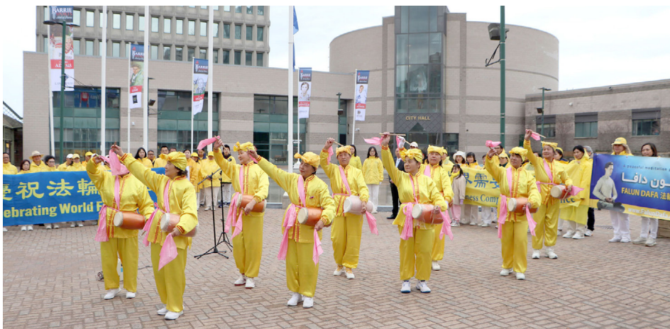
▲ 由多伦多法轮功学员组成的腰鼓队在表演腰鼓舞《法轮大法好》