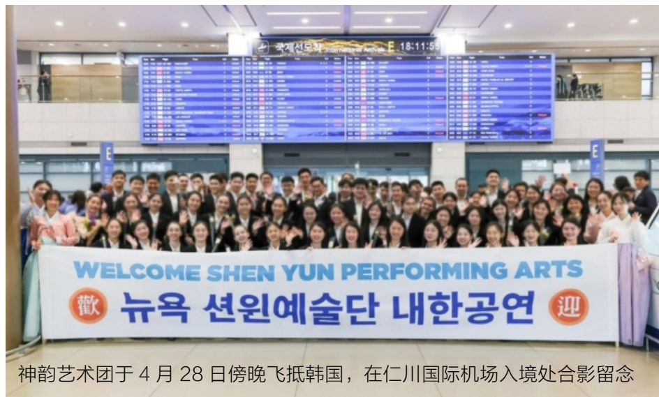
神韵艺术团于4月28日傍晚飞抵韩国，在仁川国际机场入境处合影留念

目前，该法案已进入美国参议院审议阶段，国际社会密切关注其进展。这项立法为终结长达26年的迫害带来了新希望。彻底追究中共反人类罪行的那一天已不再遥远。■