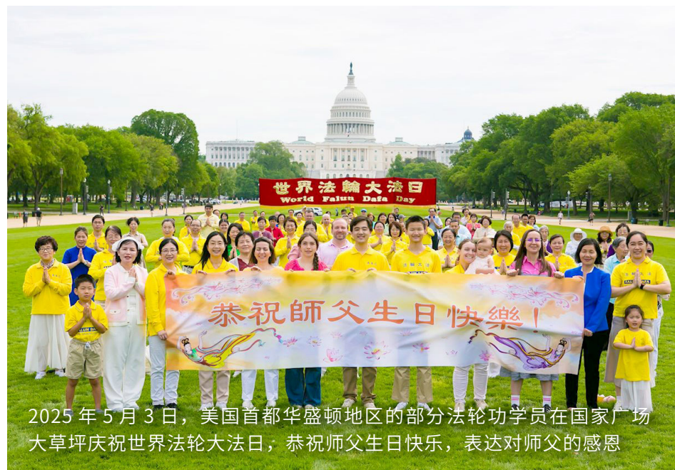
2025年5月3日，美国首都华盛顿地区的部分法轮功学员在国家广场大草坪庆祝世界法轮大法日，恭祝师父生日快乐，表达对师父的感恩

厅，我们聚集在一起，升起了这面旗帜，庆祝加拿大能够做到的一切，能够自由地践行你们的信仰，自由地生活，庆祝在中国大陆没有做到的一切。” ■