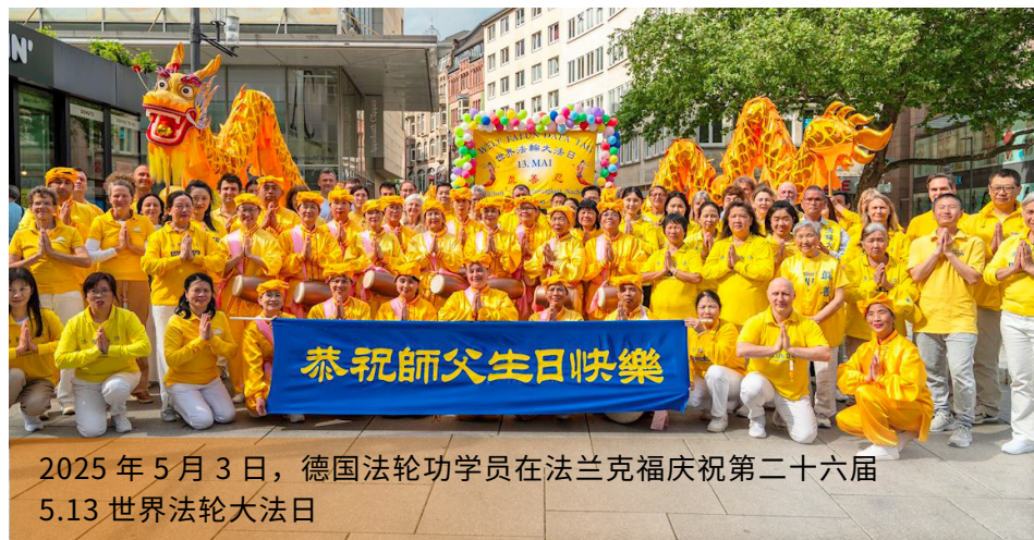
2025年5月3日，德国法轮功学员在法兰克福庆祝第二十六届5.13世界法轮大法日