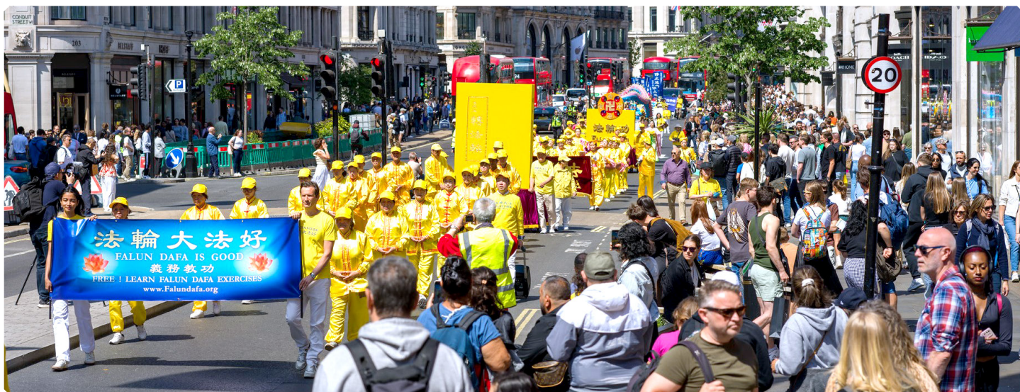
▲ 2025年5月10日，英国法轮功学员在伦敦市中心举行盛大集会、游行，庆祝第26届世界法轮大法日，暨法轮大法弘传世界33周年。