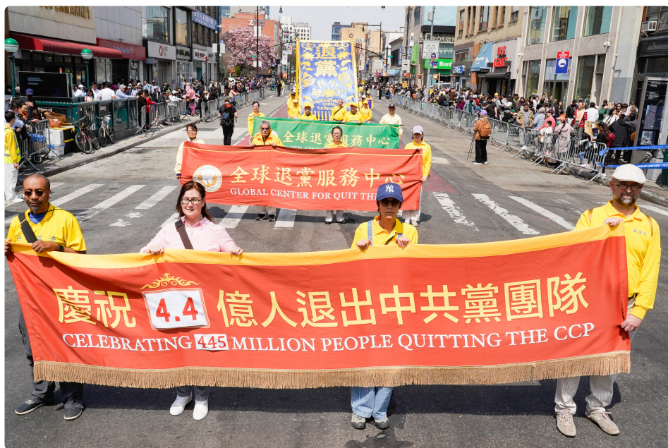
▲ 2025年4月19日，法轮功学员在纽约法拉盛举行盛大游行。