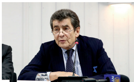
■ 杰弗里·尼斯爵士 (Sir Geoffrey Nice)

得出结论，认定“大规模活摘器官活动已在中国进行多年”，而被拘留的法轮功学员是器官的主要来源。该法庭公布的最终判决书，包括 300 页的证人证词和陈述，发现“没有证据表明，这种做法已停止”。