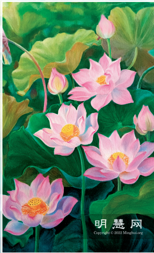
■ 油画：净莲 作者：漠（中国长春大法弟子）