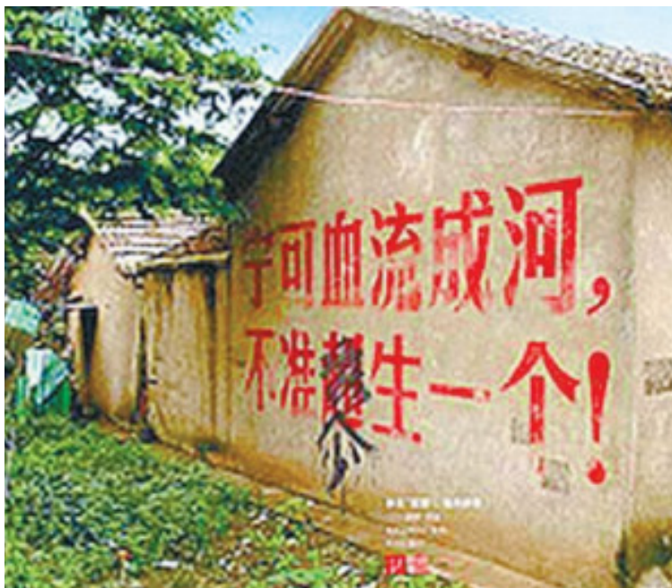
◀ 中国实施一胎化政策时期的标语