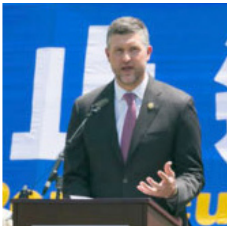
▲ 美国国会议员派特·瑞安先生