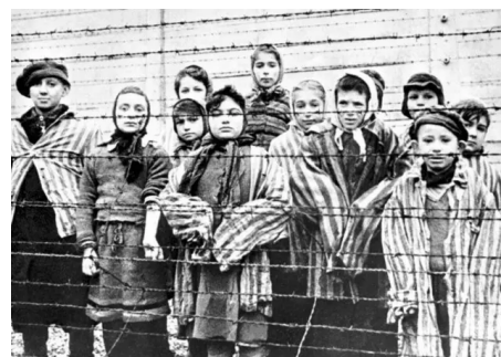
▲ 一群幸存的孩子站在纳粹奥斯威辛集中营

直到纽伦堡审判，一部名为《纳粹集中营》的纪录片才让铁证如山的真相展现在世人面前。当镜头划过堆积如山的尸体、面黄肌瘦的幸存者和仍在燃烧的焚尸炉……许多旁听者当场哭泣，有人甚至因情绪激动而晕厥。法官和检察官尽管此前可能已了解部分证据，但面对如此直观的影像，也沉默不语，神情凝重。真相终于被揭开，