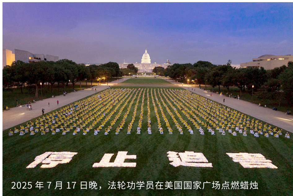
2025年7月17日晚，法轮功学员在美国国家广场点燃蜡烛