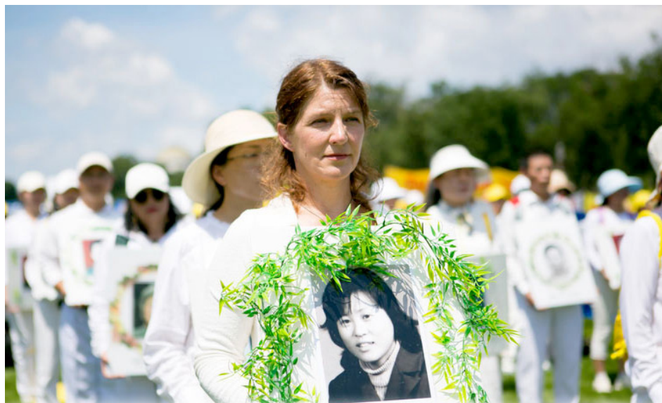
2025年7月17日，来自美国各地的部份法轮功学员在美国首都华盛顿国家广场举办反迫害集会

美国国务卿马可·卢比奥长期关注中共人权问题，谴责中共对法轮功学员的迫害。他在上届国会担任联邦参议员期间，是参议院《法轮功保护法案》的主要发起人。他在2024年表示：“共产主义中国推行邪恶的运动，并企图逃脱制裁，美国不会容忍这些做法。”