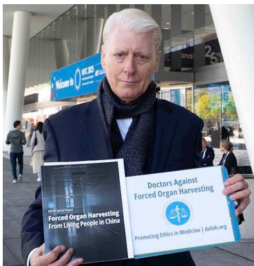
▲ DAFOH 美西代表丘吉尔

他表示，据他所知，只有约5%至10%的医生、护士和社会工作者了解在中国发生的活摘器官罪行。“中共已经将器官移植武器化，以达到根除法轮功的目的。所以我们今天在这里，希望参与器官移植的医生了解真相，希望他们能站出来帮助制止在中国发生的迫害法轮功学员和维吾尔族人的行径。”