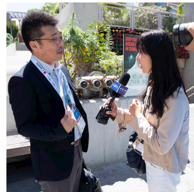
▲ 日本医生（左）新乡先生

“我有病人通过中介去中国买肾脏，一个多星期就完成移植，太恐怖了！”他说，“在日本，如果亲属捐赠，要等六个月；脑死亡者捐赠，