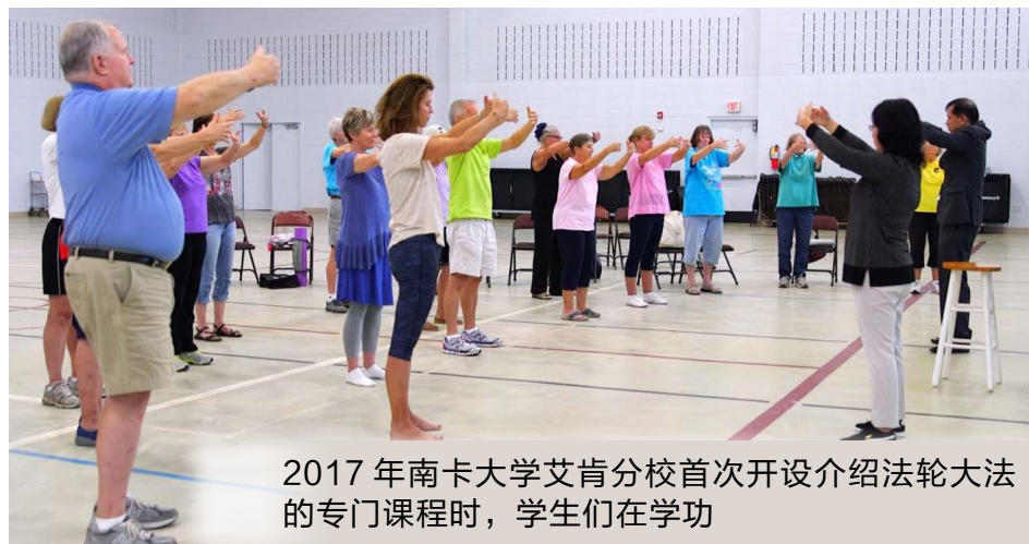
2017年南卡大学艾肯分校首次开设介绍法轮大法的专门课程时，学生们在学功

在灯火与欢呼声中，法轮花车启航的寓意提醒着人们：当传奇花朵绽放人间，这是一份值得珍惜的美好，更是一份触动心灵的启示。■