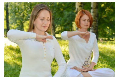
▲ 打坐让人身心平静 (示意图)

鉴于以往的成功与广泛好评，《法轮大法静坐与修炼导论》(HONS A201)将于2025至2026学年再次开设，预计会吸引更多学生踊跃报名，继续体验这门融合智慧与身心自我提升的荣誉课程。■