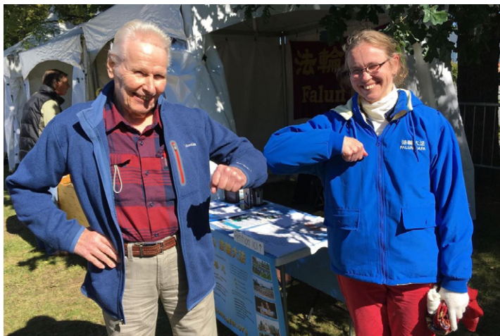
◎ 94岁的彼内特（左）与孙女在魁北克和平节上参加弘法活动。

显旺盛。他每天晚上和孙女一起读《转法轮》，他说这本书让他内心宁静，记忆力也增强了。