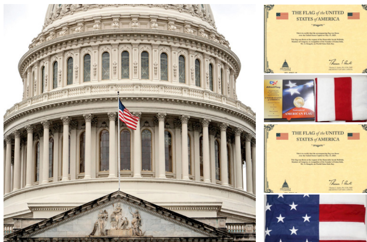
◎美国国会大厦再次升旗向法轮大法创始人致敬，并赠送国旗和证书。

门带给世界”，并祝愿“这一天成为人类坚韧的精神力量与善良、和平、内在修养的恒久象征。”