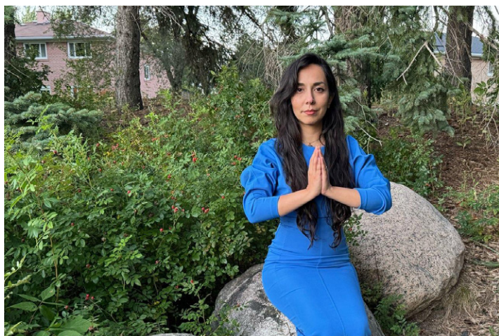
◎埃尔纳兹感谢师父传出法轮大法，让她的生活充满阳光。

30多人丧生，百余人受伤。炸弹在离我两米远处爆炸，我却安然无恙。谢谢师父的保护！”