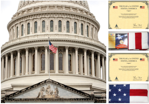
◎美国国会大厦再次升旗向法轮大法创始人致敬。右图为赠送的国旗和证书。