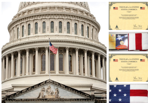
◎美国国会大厦再次升旗向法轮大法创始人致敬。右图为赠送的国旗和证书。