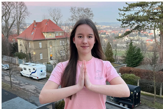
◎17岁的彬迪感恩师父的慈悲指引，让她从小就走上了修炼路。

因为我明白什么是对的，所以越来越自信。能走在修炼的路上，我的喜悦和感激无以言表。”